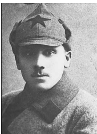
Наум Исаакович Эйтингон, прославленный советский разведчик.

6 декабря 2009 года исполнилось 110 лет со дня рождения Наума Эйтингона, легендарного советского разведчика, известного также под именами - Леонид Александрович Наумов, Котов, Том. Из всех разведчиков в годы Великой Отечественной войны только Н.Эйтингон и П.Судоплатов были награждены полководческим орденом Суворова.