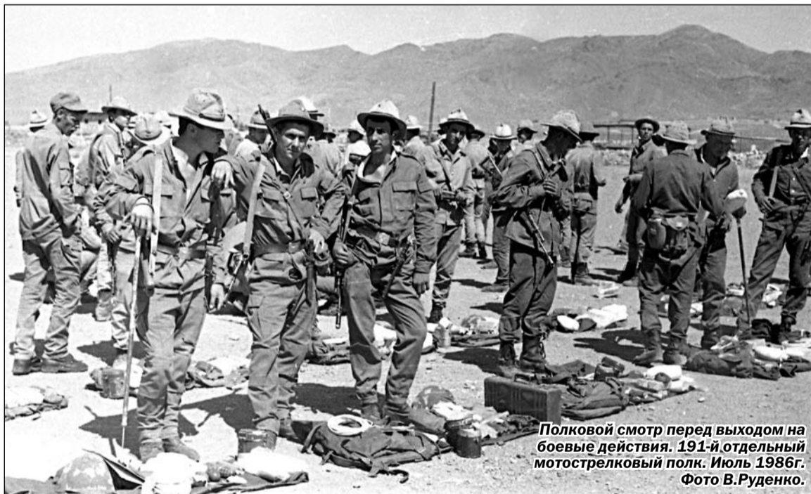
Полковой смотр перед выходом на боевые действия. 191-й отдельный мотострелковый полк. Июль 1986г.