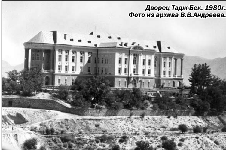
Дворец Таж-Бек. 1980г.