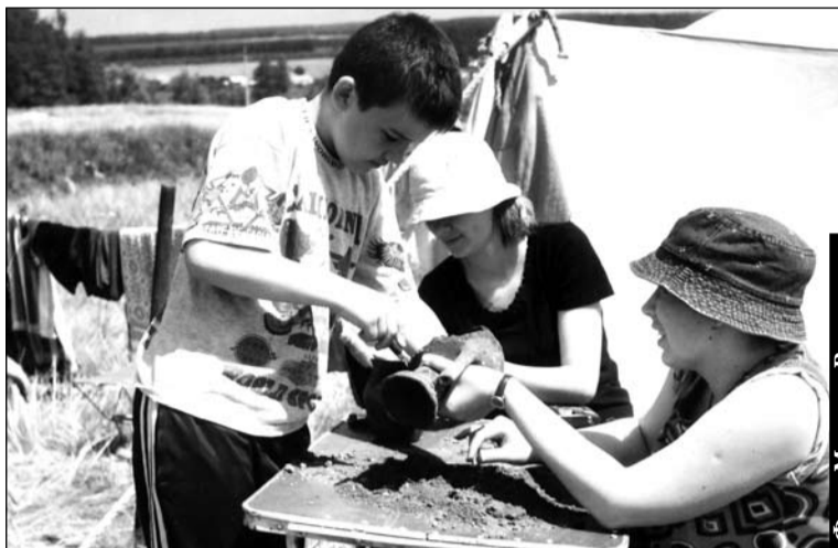
Находки требуют внимания.

Со временем наши выпускники, а также люди, связанные с ними