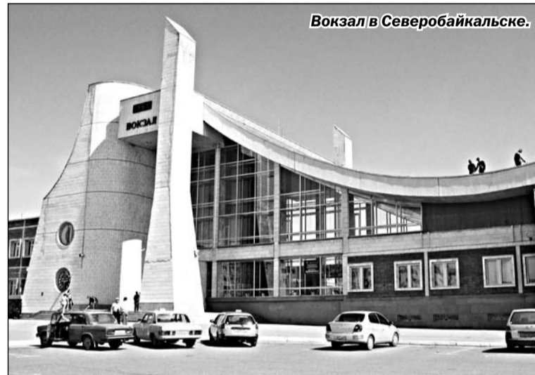
Вокзал в Северобайкальске.

воронежского мостозавода. «Работали с увлечением, самоотверженно. Когда отправляли пролеты моста через Лену в 1975 году, состоялся митинг с оркестром. Если же говорить о том, как мы отправляли пролеты для мостов через Амгунь, Зею, Олекму и другие крупные реки, то происходило это буднично. Работы было много и не до митингов было. А время то было прекрасное, полное смысла и созидания».