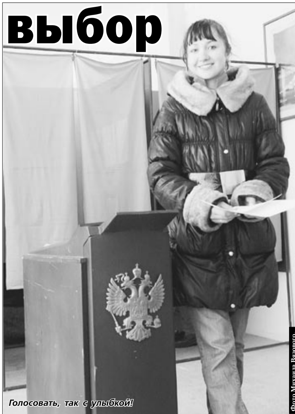
Голосовать, так с улыбкой!