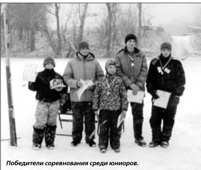
Победители соревнования среди юниоров.