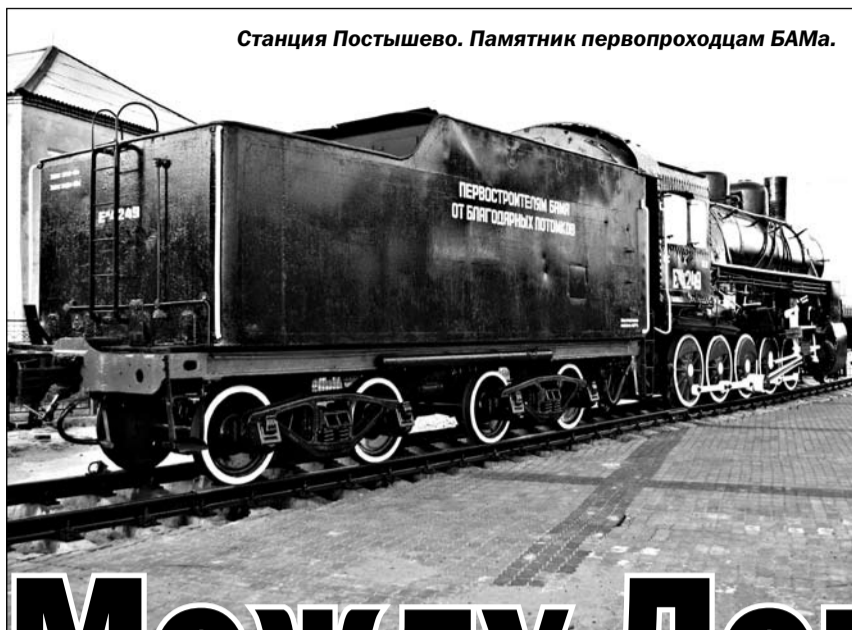
Станция Постышево. Памятник первопроходцам БАМа.