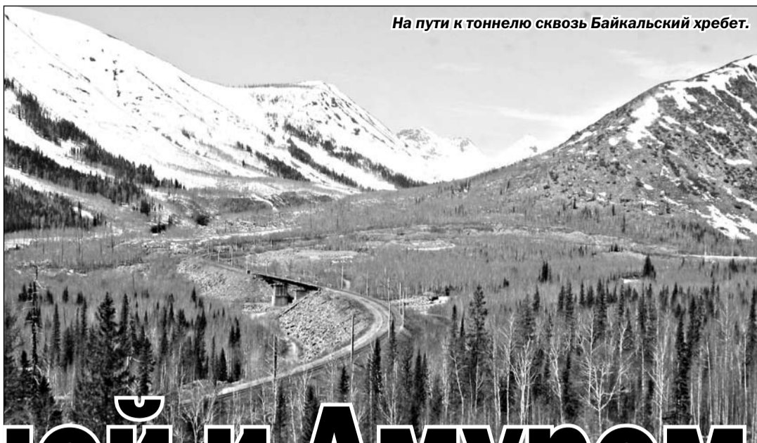
На пути к тоннелю сквозь Байкальский хребет.