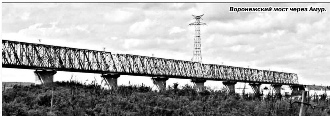
Воронежский мост через Амур.

не воспользоваться возможностью самому увидеть то, что порой показывают по телевизору, узнать из первых уст о том, как живут люди вдалеке от Большой земли. Хотя именно у них она самая большая. Сибирские и дальневосточные масштабы прямо-таки космические для европейцев. Большой БАМ – от Тайшета до Советской Гавани – 4324 километра. Его западное (Тайшет – Лена) и восточное крылья (Комсомольск-на-Амуре – Со-