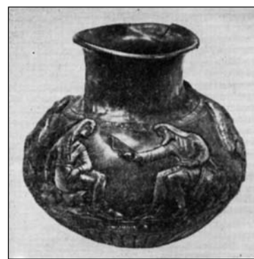
Сосуд с изображением скифов. Серебро; чеканка, позолота. Скифская культура, 4 в. до н.э. Частые курганы, курган 3, Средний Дон, близ г.Воронежа, Россия.