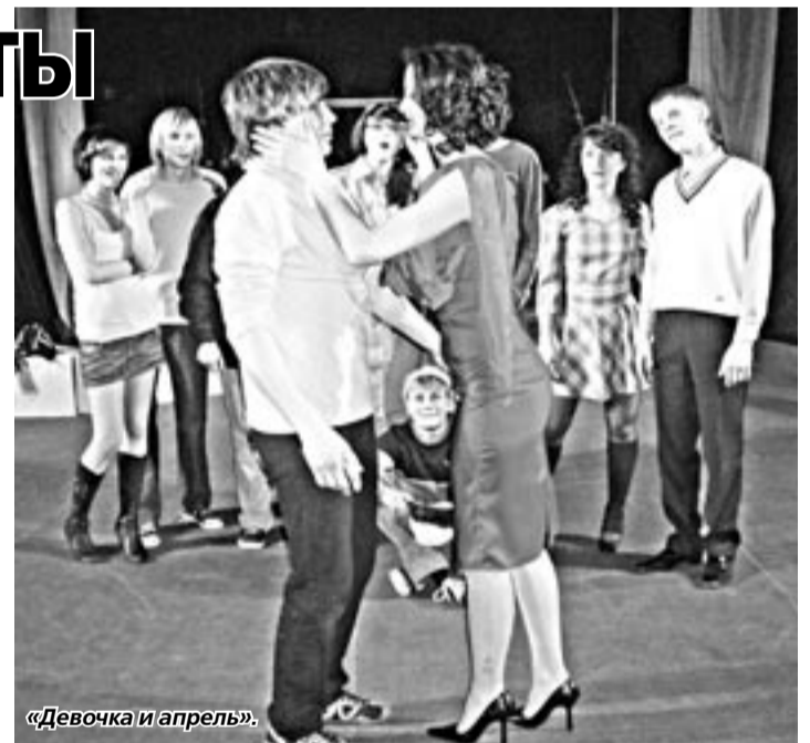
«Девочка и апрель».

«Пьеса старенькая, - признаётся режиссёр, - но мы её попытались обновить». Выразилось это, например, в том, что среди возвышенных споров Охмингузе и снежном человеке там и сям вставлены молодёжные словечки вроде «приколно» или «жесть». Интересно, однако, что юные зрители противоречия не замечают и охотно идентифицируют себя с персонажами «Девочки и апреля».