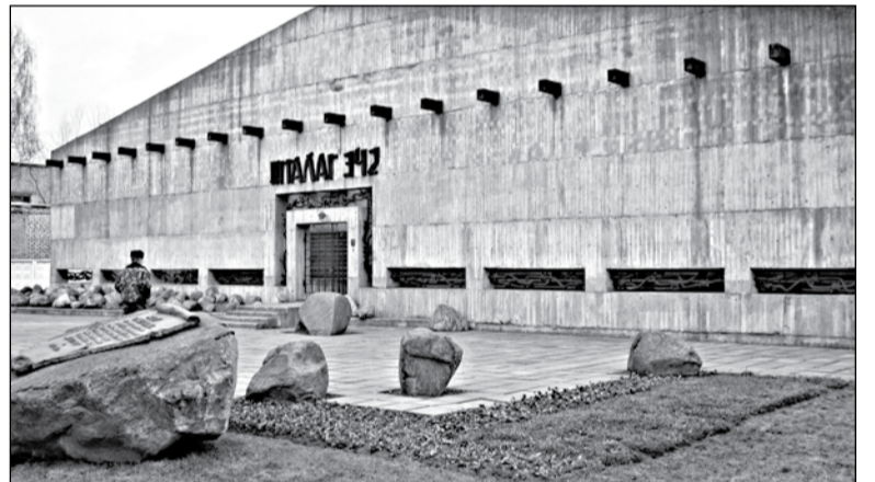
плексе «Шталаг-342». Прикоснулись к плитам, на которых имя их отца и деда, возложили цветы... В 21 братской могиле захоронены