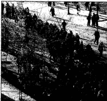
Очередь занимали за несколько дней до матча.