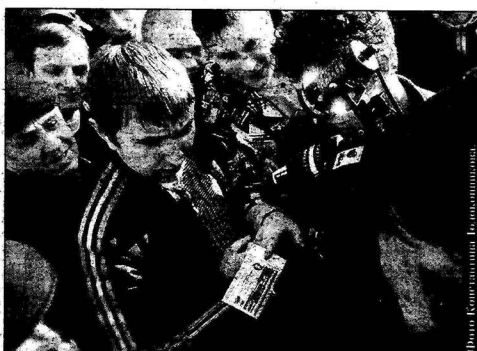
С трудом добывать билет.