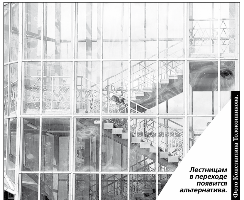
Лестницам в переходе появится альтернатива.

Министерство внутренних дел согласилось профинансировать строительство лифта на надземном пешеходном переходе, построенном у Центрального автовокзала в Воронеже. Чтобы принять такое решение в город по приглашению губернатора приехала специальная комиссия из Москвы, которая уже на месте убедилась в необходимости установки лифта. Напомним, что переход, на возведение которого было потрачено более 80 млн. рублей, не оснастили лифтами. Пожилым людям, да ещё и с тяжёлыми сумками, было не под силу преодолеть три лестничных пролёта. Инвалидам-колясочникам также было невозможно подняться по переходу. Недовольство воронежцев и гостей столицы Черноземья было услышано, и теперь ситуация с лифтом может измениться в лучшую сторону.