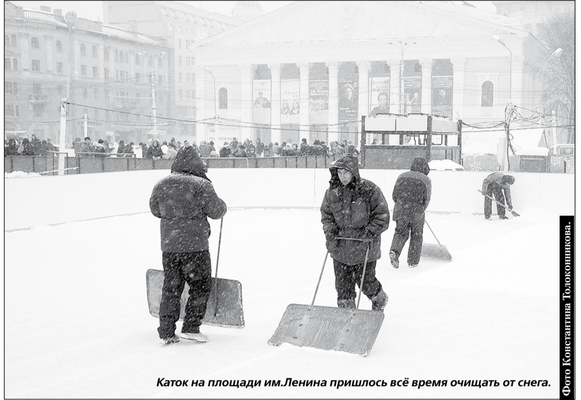
Каток на площади им.Ленина пришлось всё время очищать от снега.

В ночь со вторника на среду в Воронеже прошел сильный снег