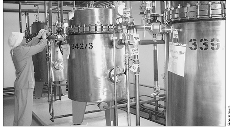
Приготовление растворов на участке ПРИОС.

В России есть примеры производства инсулина, но практически все предприятия производят лекарство из импортной субстанции, т.е. исходного вещества. А значит, в случае прекращения ее поставок выпуск препарата может быть остановлен.