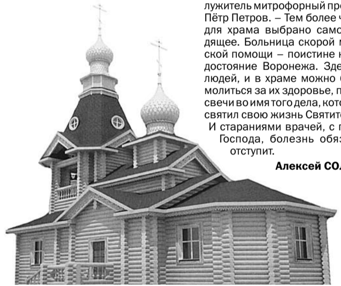
Таким будет храм рядом с БСМП.

ГОНОРАР ЗА ПУБЛИКАЦИЮ АВТОР ПЕРЕЧИСЛЯЕТ НА РАСЧЁТНЫЙ СЧЁТ 4070381060000000364 в Центрально-Чернозёмном АКБ «Инвестбанк» (ОАО) г. Воронеж Местная религиозная организация православный приход храма во имя Св. Николая Чудотворца г. Воронежа религиозной организации «Воронежская и Борисоглебская Епархия Русской Православной Церкви (Московский патриархат)» к/с 3010181010000000851, ИНН 3666060640, КПП 366601001 БИК 042007851 НАЗНАЧЕНИЕ ПЛАТЕЖА: Пожертвование на строительство храма во имя Святителя Луки на территории БС МП, без НДС