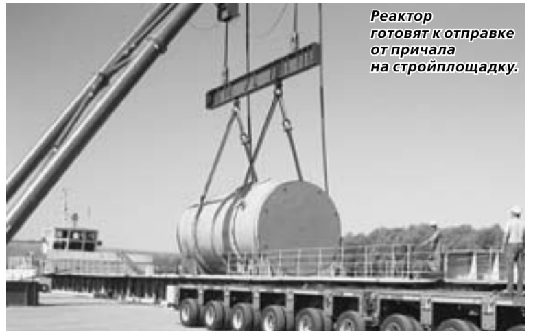
Реактор готовят к отправке от причала на стройплощадку.