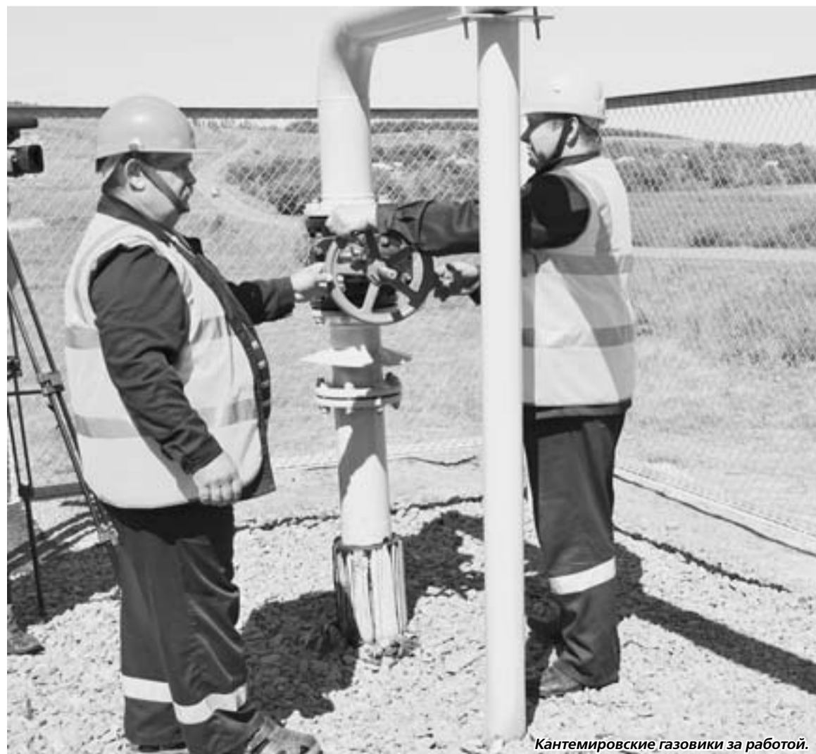
Кантемировские газовики за работой.