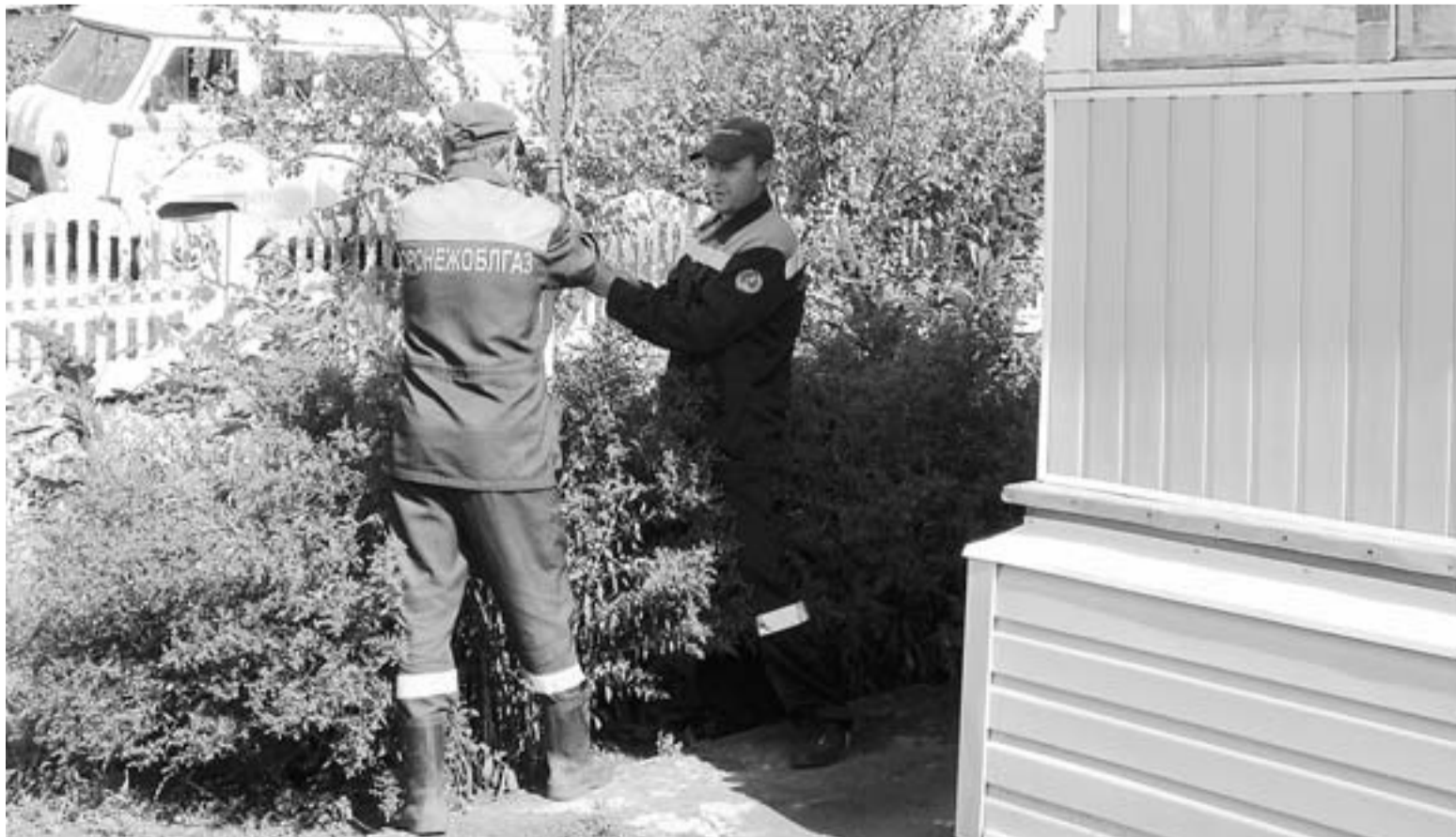
Газовики выполнили свои обязательства досрочно, до наступления холодов.