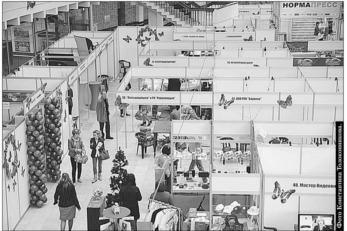
Выставка, прошедшая в рамках форума маркетинговых коммуникаций, была интересной и полезной.

Экспозиция, что и говорить, была богатой и разнообразной. К при-