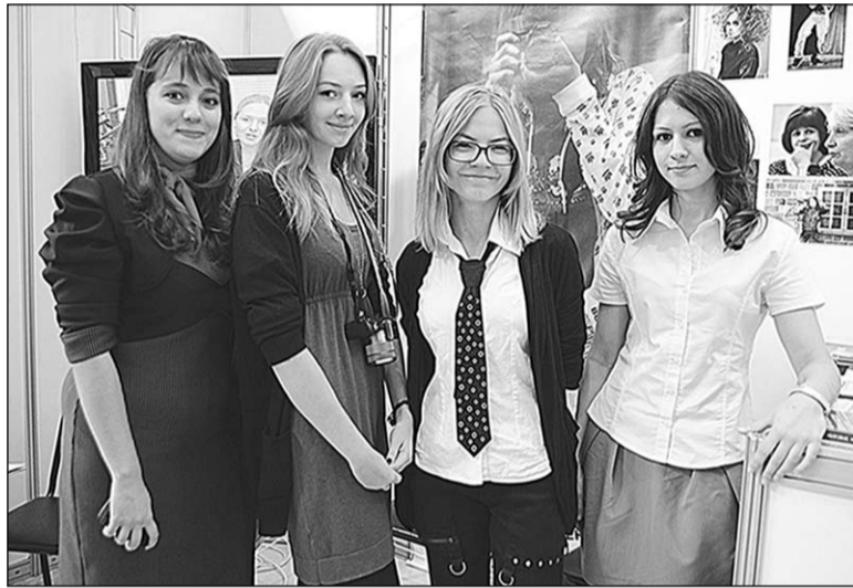
У стенда факультета журналистики ВГУ.

Рекламные компании, производители сувенирной продукции, вент-агентства столицы и регионов Центрального Черноземья в минувший четверг представили во Дворце творчества детей и молодежи Воронежа свою продукцию и услуги и приняли участие в работе форума маркетинговых коммуникаций.