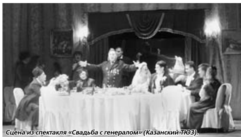
Сцена из спектакля «Свадьба с генералом» (Казанский ТЮЗ).