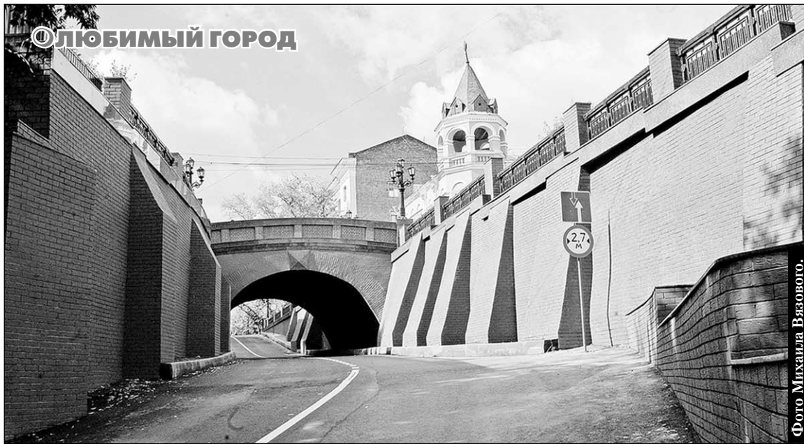
О ЛЮБИМЫЙ ГОРОД