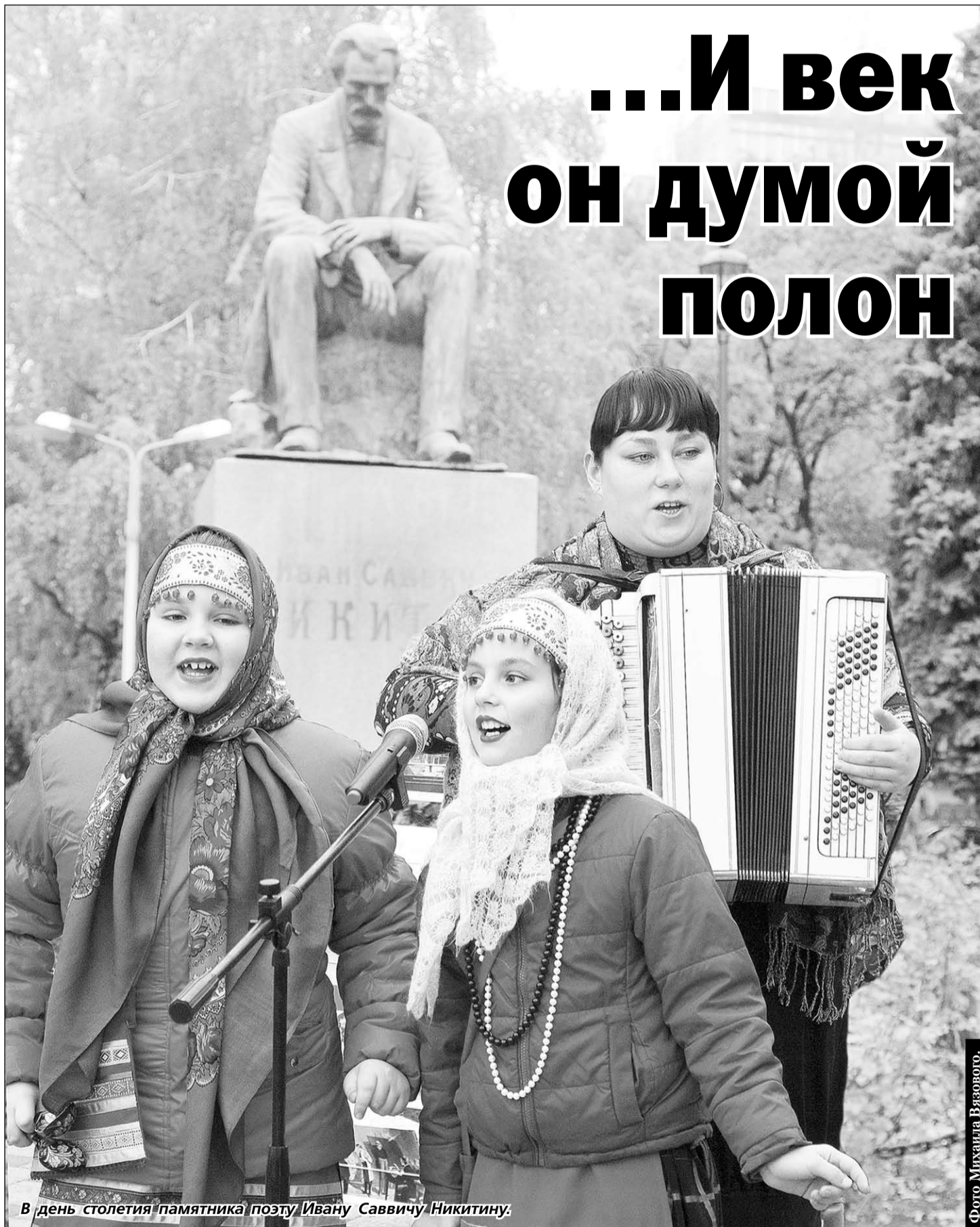
В день столетия памятника поэту Ивану Саввичу Никитину.