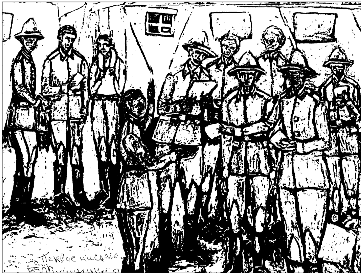
ПЕРВОЕ ПИСЬМО. Рисунок Валерия Мишунина (Шинданд, 5-я мотострелковая дивизия, 1983–1985 гг.)

- У Таблетки взорвалась тротиловая шашка в руках. Руки от... чило, вырвало мясо из груди, так его перетак.