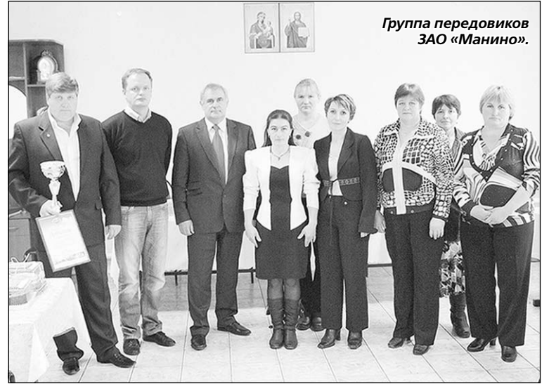
Группа передовиков ЗАО «Манино».