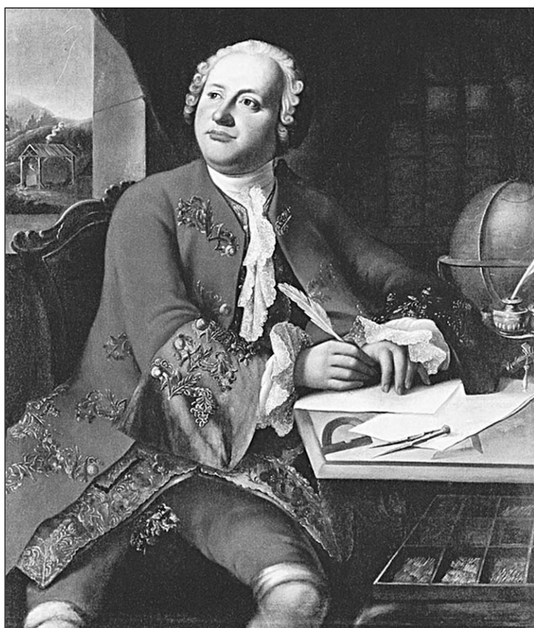
Прижизненный портрет Ломоносова кисти Георга Преннера. 1750г.

Идею о молекулярном строении вещества он высказал задолго до того, как на Международном съезде химиков Карлсруэ были сформулированы точные понятия о молекуле и об атоме. Увы, и на этот раз вклад Ломоносова остался незамечен-