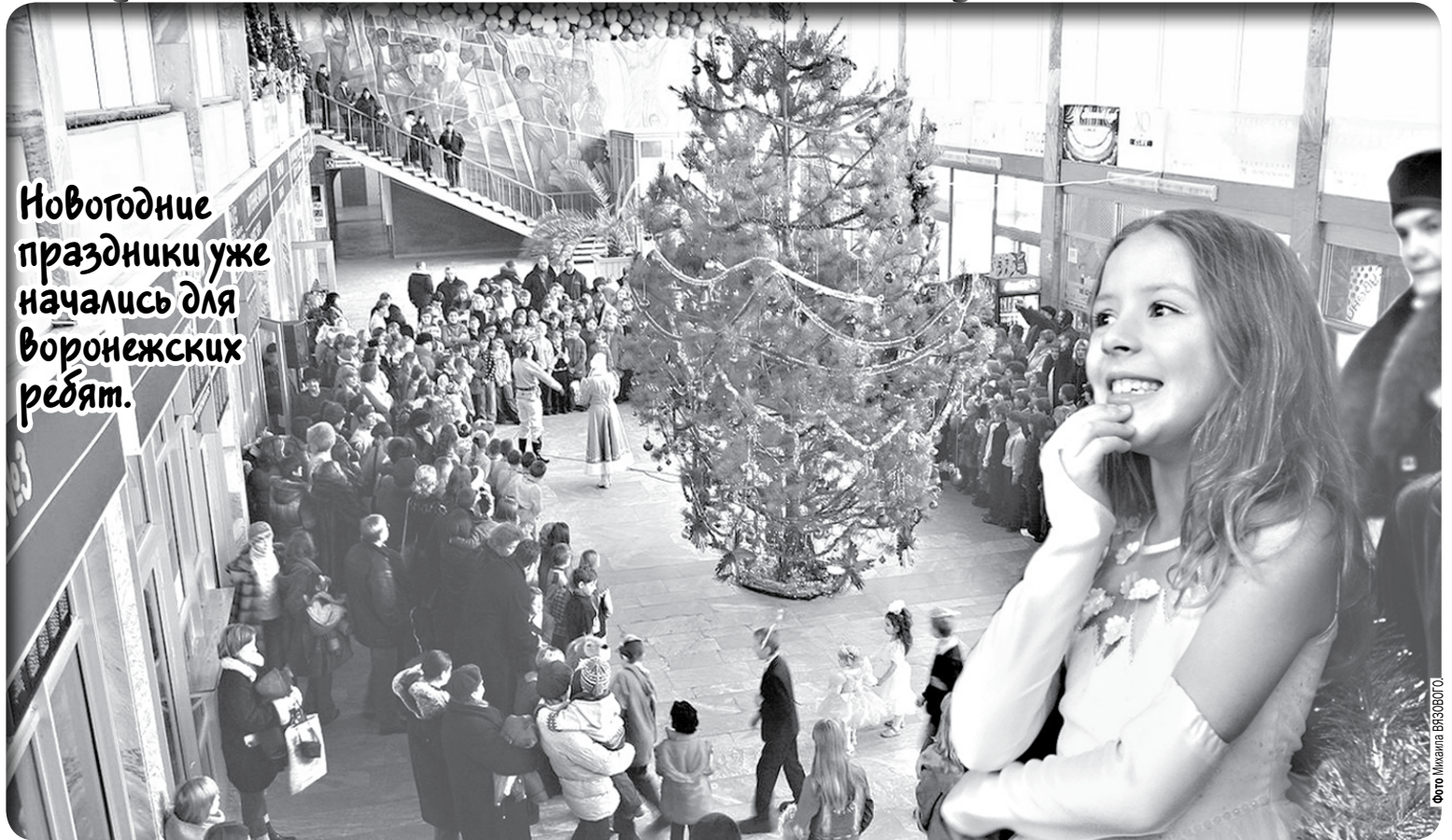
Новогодние праздники уже начались для воронежских ребят.