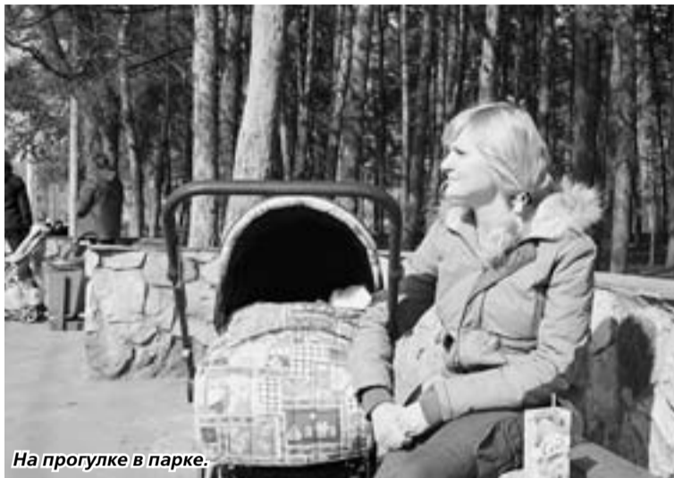
На прогулке в парке.

— Он... — отвечаю я и думаю: вот если это не он, то я сейчас оговорю ни в чём не повинного человека. Хотя — стоп! — как это «неповинного»? Если он попал в компьютер полицейский в качестве фоторобота, значит, он уже в чём-то провинился или по крайней мере подозрева-