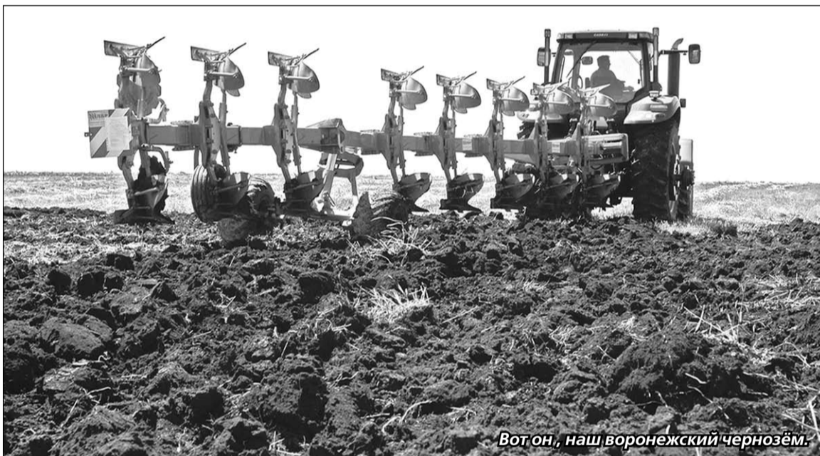
Вот он, наш воронежский чернозём.

Назывался Париж, хотя Международное бюро мер и весов располагается под Парижем, в Севре.