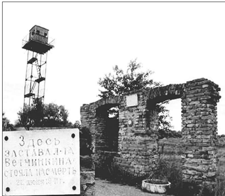
На заставе Кузьмы Ветчинкина.

Конечно, это была не такая всеобъемлющая помощь, которую оказывал на территории Данковского уезда Рязанской губернии (ныне Данковский район Липецкой области) великий русский писатель Л.Н.Толстой. Но скромная деятельность Эртеля и его добровольных помощников помогла спасти от голодной смерти тысячи крестьян.