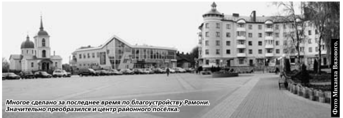
Многое сделано за последнее время по благоустройству Рамони. Значительно преобразился и центр районного посёлка.

Напомним, сооружение Нововоронежской АЭС-2 (два энергоблока мощностью 1,2 тысячи МВт каждый) в Воронежской области началось в 2007 году по проекту «АЭС-2006», в котором впервые в России применена реакторная установка ВВЭР-1200. Первый энергоблок станции планируется ввести в эксплуатацию в 2013 году, второй - в 2015.