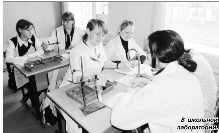
В школьной лаборатории.