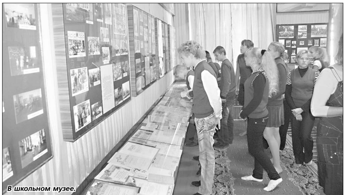
В школьном музее.

Он никогда не сетовал на трудную жизнь. Он просто собственным трудом делал эту жизнь. Как умел, насколько хватало сил и мастерства. Но ни в чём и никогда не давал себе поблажки.