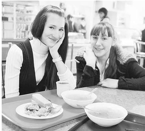
Здесь готовят только полезную пищу.

Ещё одно новшество – индивидуальное оформление внешнего вида отдельных блюд. Например, мучные изделия продаются в упаковке «флоу-пак» (или брикет), каши, запеканки, пельмени – в керамических горшочках, салаты и пудинги – в креманках и кокотницах, а горячие напитки и супы – в термостаканах с крышкой.