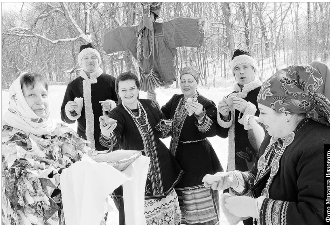
Фольклорный ансамбль «Радость» с масленичной песенной программой в Верхнехавском районе.