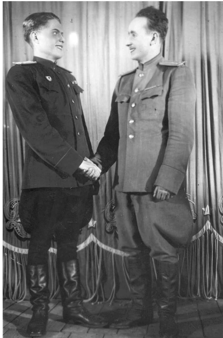
Сцена из спектакля «Я хочу домой».

Знаю, что потом, в новом великолепном Дворце творчества детей и молодёжи, были (и, наверное, есть) драмколлективы и даже целые театры с другими руководителями. Но это уже совсем другие истории.