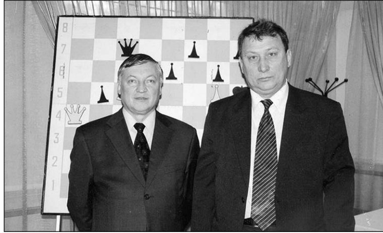
Многочратный чемпион мира по шахматам Анатолий КАРПОВ и почётный президент РОО «Шахматная федерация Воронежской области» Юрий СЕЛЯВКИН.

Ложный след: 1.Ле5?, но Cd3! Решение: 1.Ле4! с угр. 2.Ла4 X. 1...Ce4 2.Лa6 X.