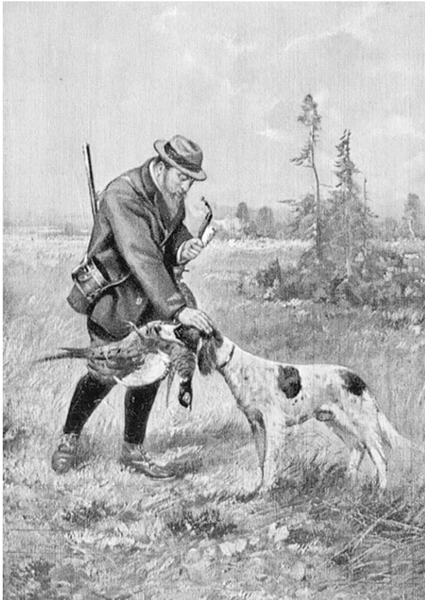
Охота на тетеревов. Старинная открытка.

На картах Коротоякский уезд изображен в виде узкой капризно изогнутой фигуры, протянувшейся с востока на запад. Площадь его равняется 3153 квадр. верстам, 202987 квадр. сажаням; население около 150000 душ. Освоение Коротояка восходит к той же эпохе, как и Острогожска, даже несколько раньше, а именно к 1648 г. При этом преследовались одни и те же цели: защита южных границ русского государства от татарских набегов. Коротояк, подобно другим городам, принадлежит к сторожевой линии, тянувшейся длинным рядом укреплений от северо-востока к юго-западу. О происхождении его названия ходит такой анекдот. Раз какому-то... вздумалось попутешествовать; путь его лежал как раз через то место, где