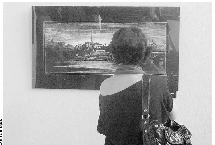
На выставке «Чернозём».

- Жизнь в Воронеже мне видится вот такой. Получилось у меня или нет — это судить уже вам.