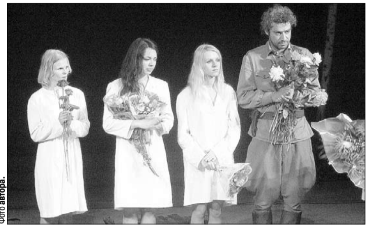
Для некоторых воспитанниц театральной студии это были первые гастроли.