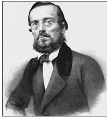
Николай Иванович Костомаров.