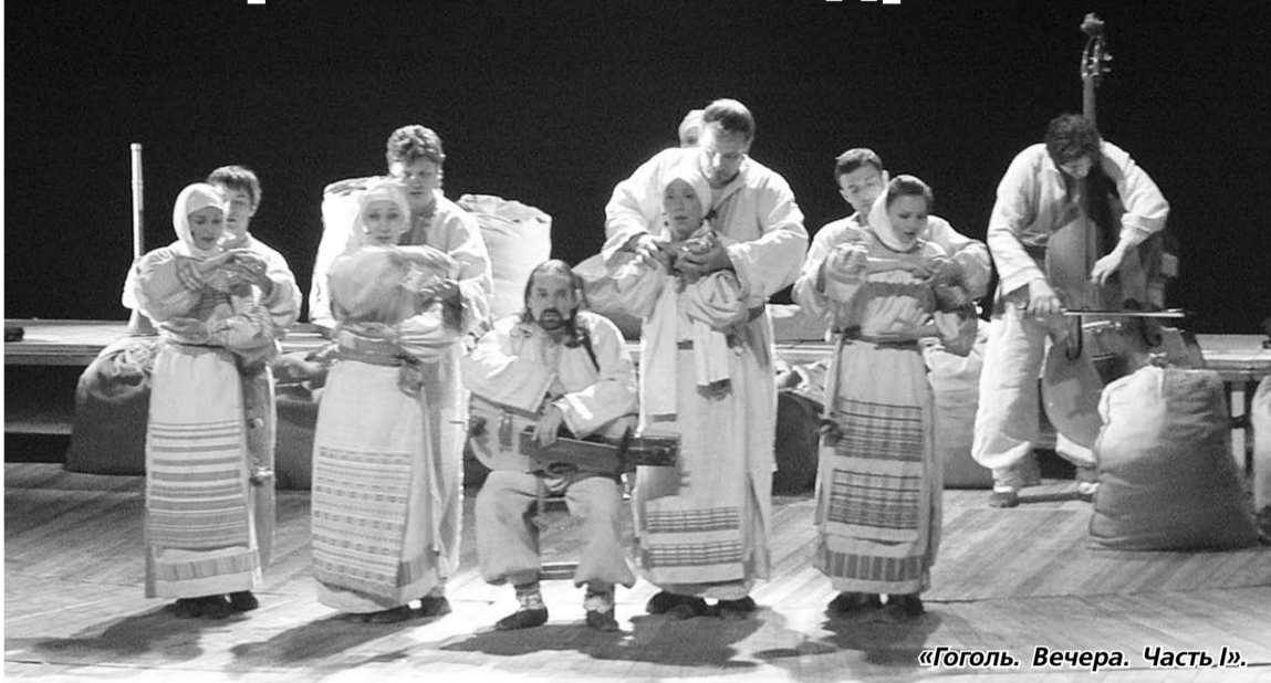
«Гоголь. Вечера. Часть I».