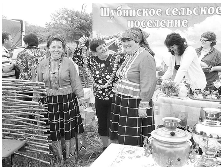
Культработники села Шубное, что в Острогожском районе, ведут большую работу по пропаганде фольклора, народного искусства.