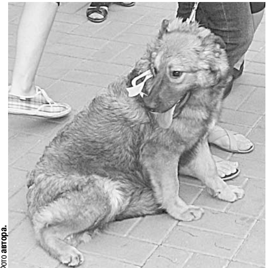
«Возьми меня к себе. Я тебя буду любить!»