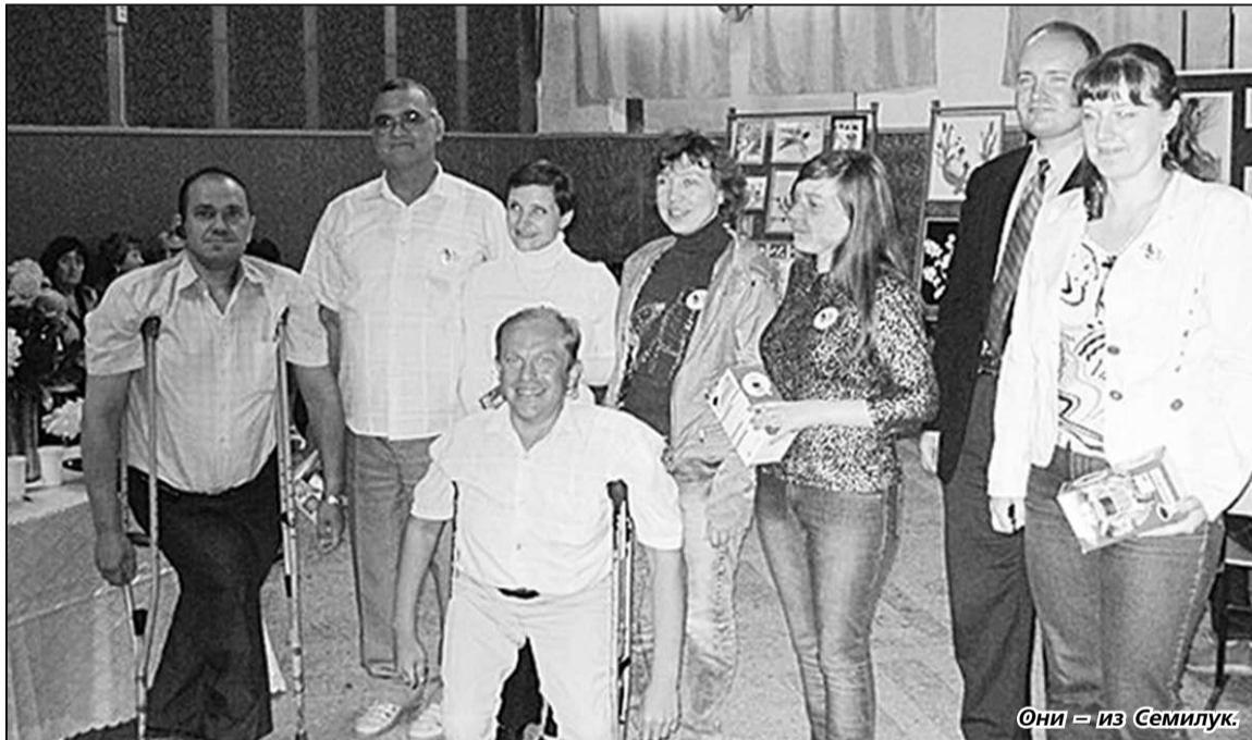
Они – из Семилук.

Напомним, страдавшую от чрезмерной всенародной «любви» композицию с выдернутыми на «добрую память» усами, треснувшим тельцем и переломанными лапами, забрали на ремонт третьего мая. И вот, на днях «Котёнка с улицы Лизюкова» вернули на место. «И всё же для котёнка по имени Василий прекраснее Воронежа нет города нигде», – кажется, герой вот-вот оживёт и споёт свою песенку. А радоваться есть чему. Новая композиция выполнена из антивандальной нержавеющей стали. У Василия, как у всех котиков на свете, сейчас красивый нос розового цвета, ну а Ворона, как истинная женщина, да ещё и в летний день покрасила свои ногти. Навели порядок и на прилегающей к композиции территории.