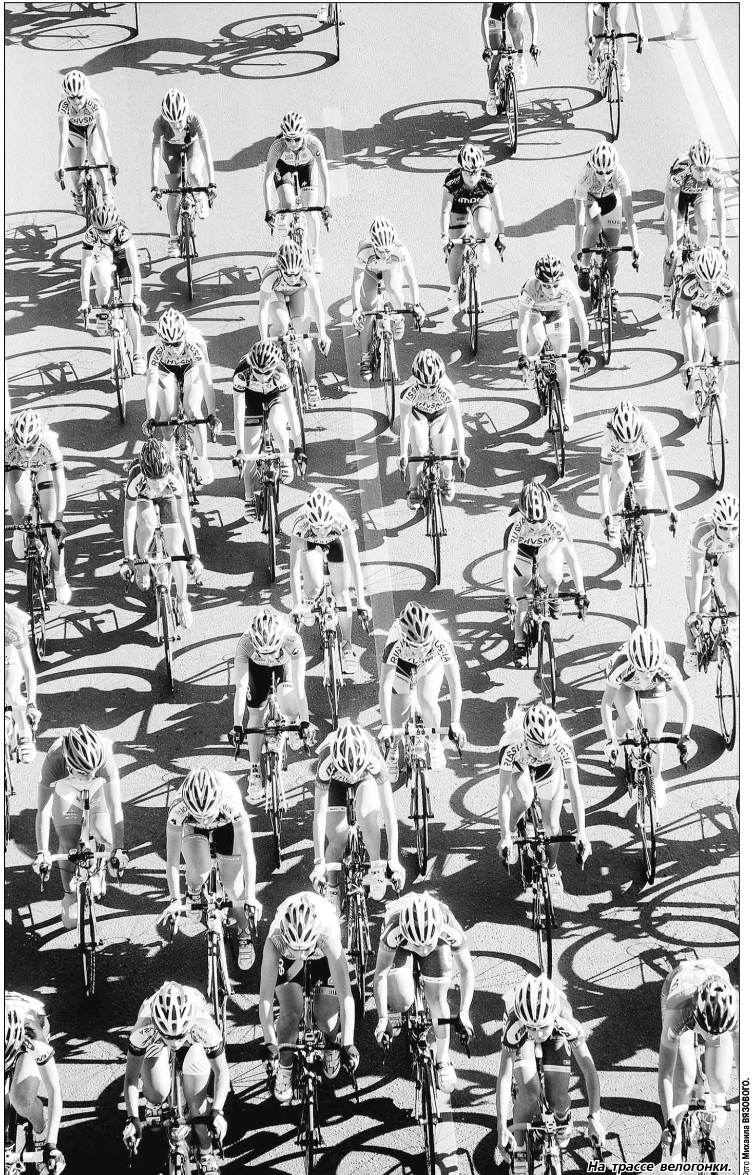
На трассе велогонки.