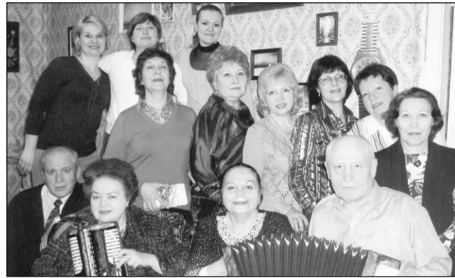
Вся их жизнь связана с народной песней.

На основе хоровых занятий Учебно-методический центр выпустил в 2010 году пособие «России славные напевы» со-