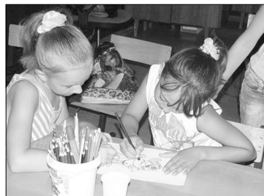
В каждом рисунке – лето!

Как только отдохнут в лагере школьники младшего и среднего звена, в него заедут их старшие товарищи. Для них здесь будет открыт ещё один лагерь – оборонно-спортивный. И в нём тоже будет много интересных, ярких мероприятий, которые, возможно и станут главной темой сочинений «Как я провёл лето».