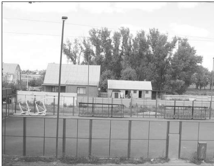
Стадион по программе «Газпром — детям» построен в калачеевской гимназии №1.

Интерес к спорту у калачеевцев не ограничивается посещением стадиона. Развитию физкультуры и спорта здесь уделяют приоритетное внимание. Сейчас в каждом микрорайоне города, в сельском поселении реализуется программа по реконструкции и установке детских спортивных площадок. Ведётся строительство футбольных полей по программе «Газпром — детям». Готова и проектно-сметная документация на физкультурно-оздоровительный комплекс, который возведут в посёлке Пригородном.