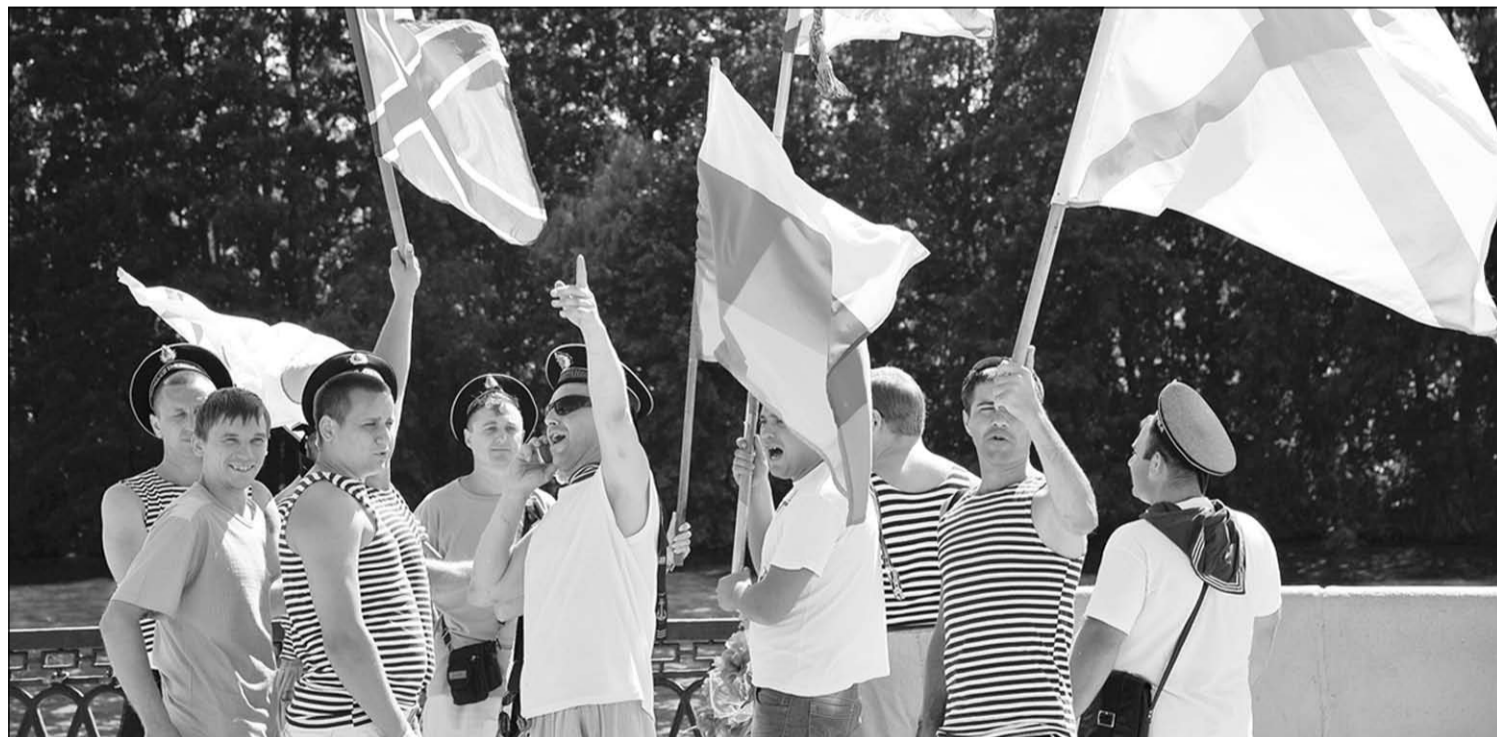
День Военно-морского флота в Воронеже.