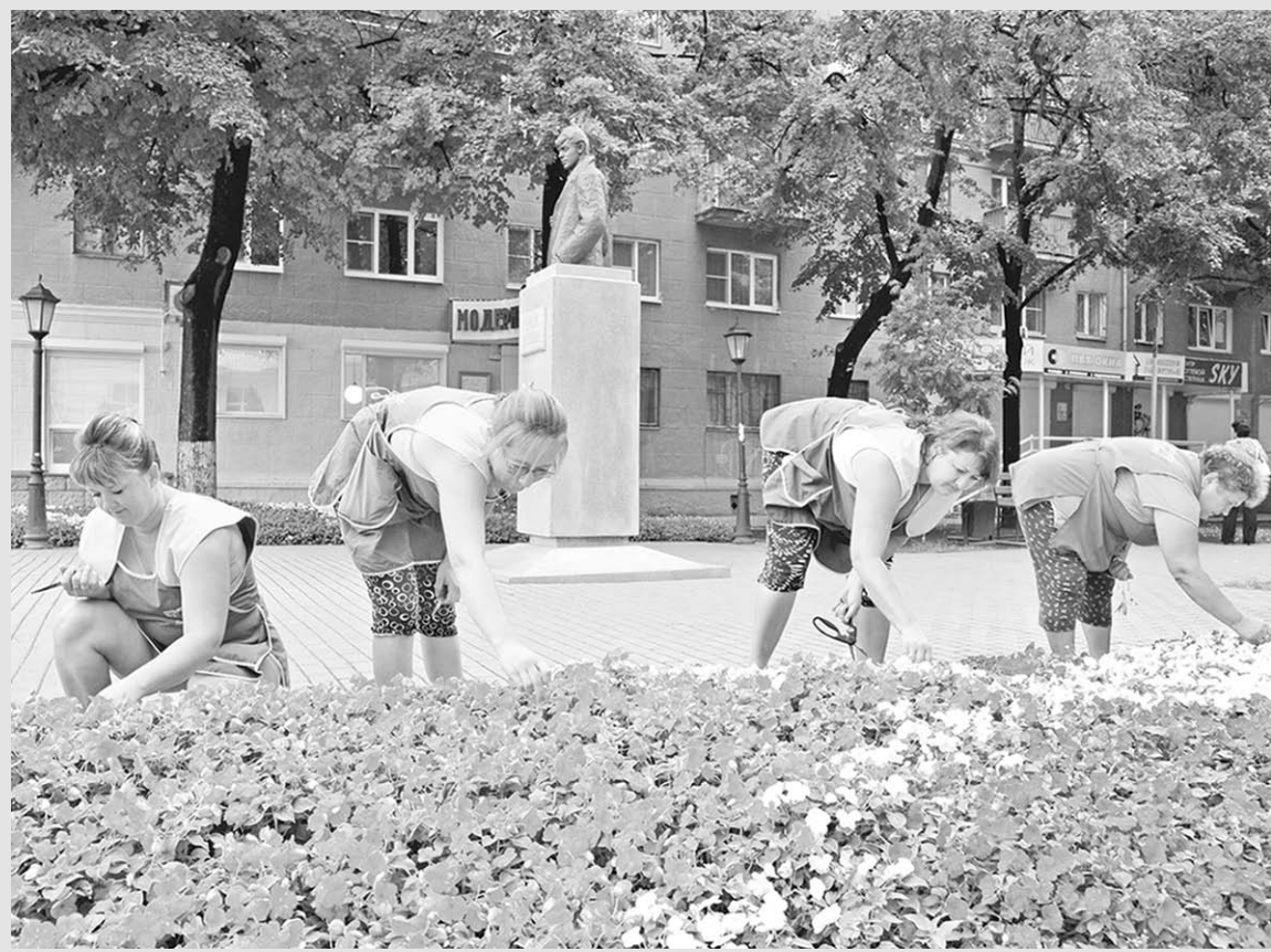
Всё больше и больше появляется в центре Воронежа клумб и газонов.