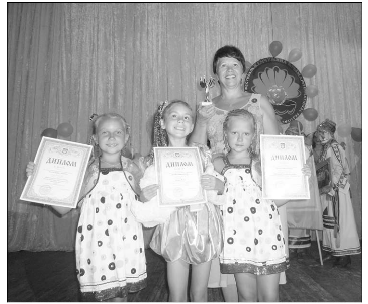
Вернулись из Алушты с дипломами.