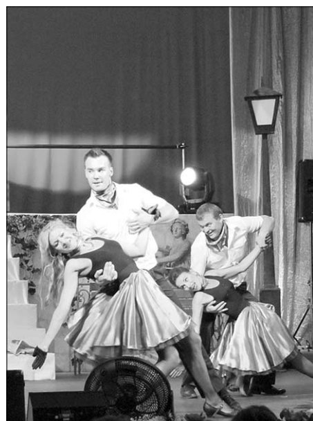
Танцуют воронежские таможенники.