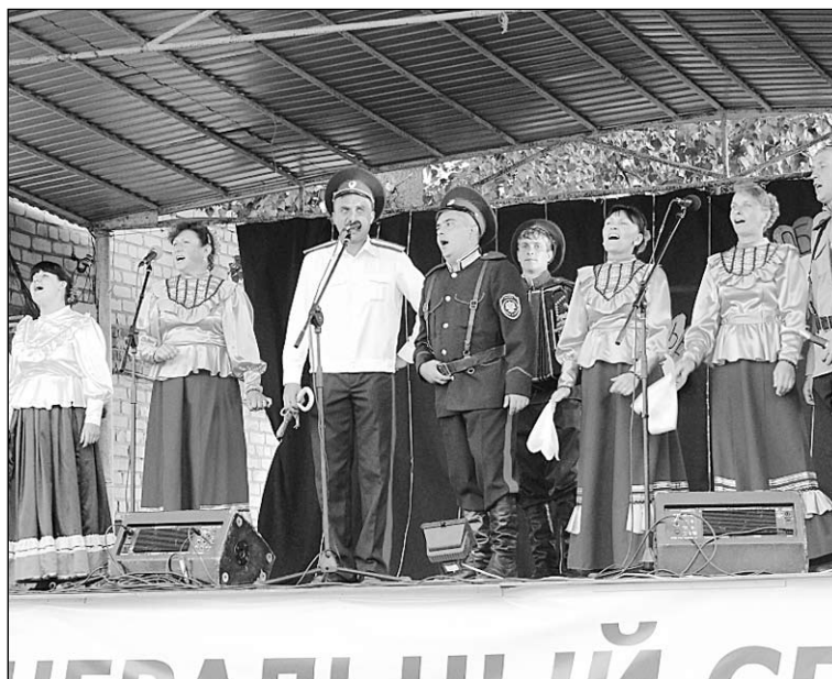
Звучит казачья песня.