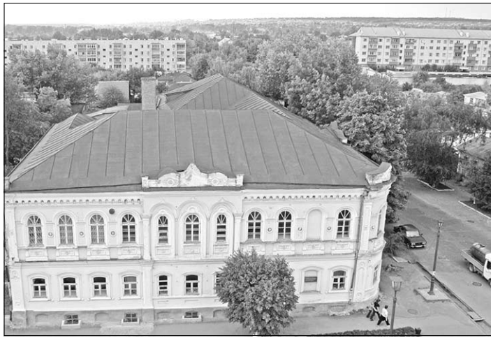
Один из памятников архитектуры Острогжска.

Благодарные завсегда городские мероприятия в праздничный день собрались на «зеленой» эстраде, предвкушая сюрпризы. Ожидания оправдались с первых минут торжества, когда на бричке