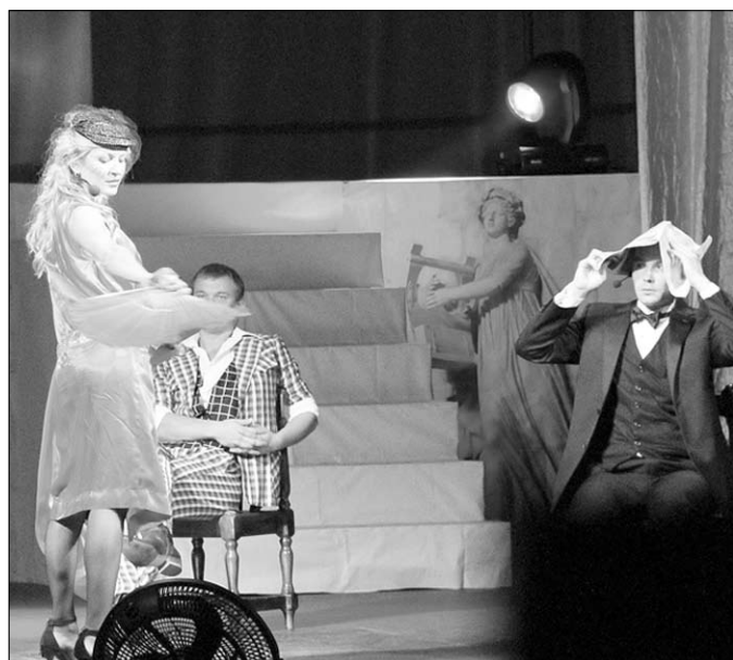
Сцена из постановки «Четверо».