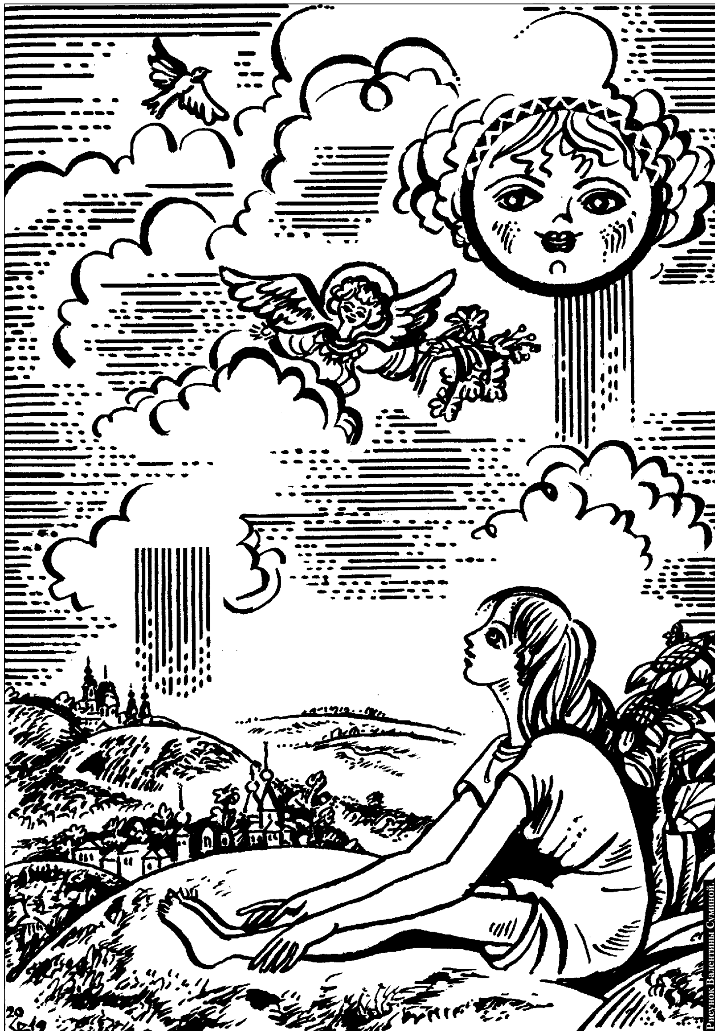
Рисунок Валентины Суминой.