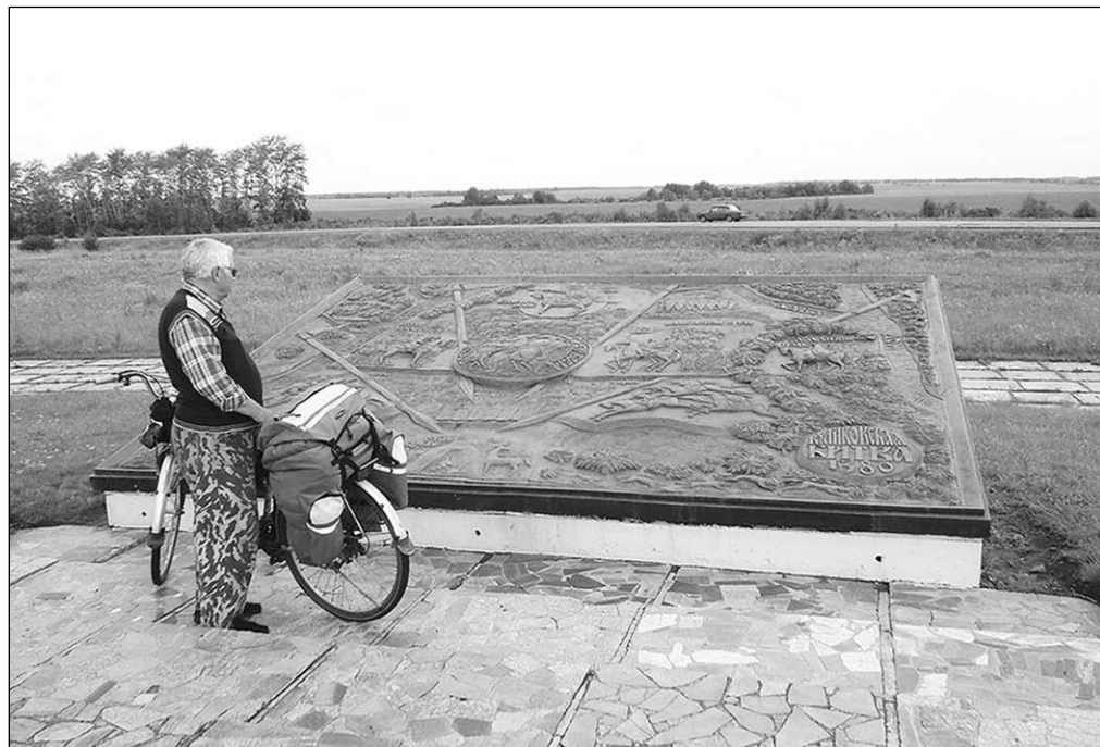
Перед дальней дорогой.