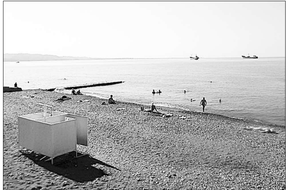
У синего моря.