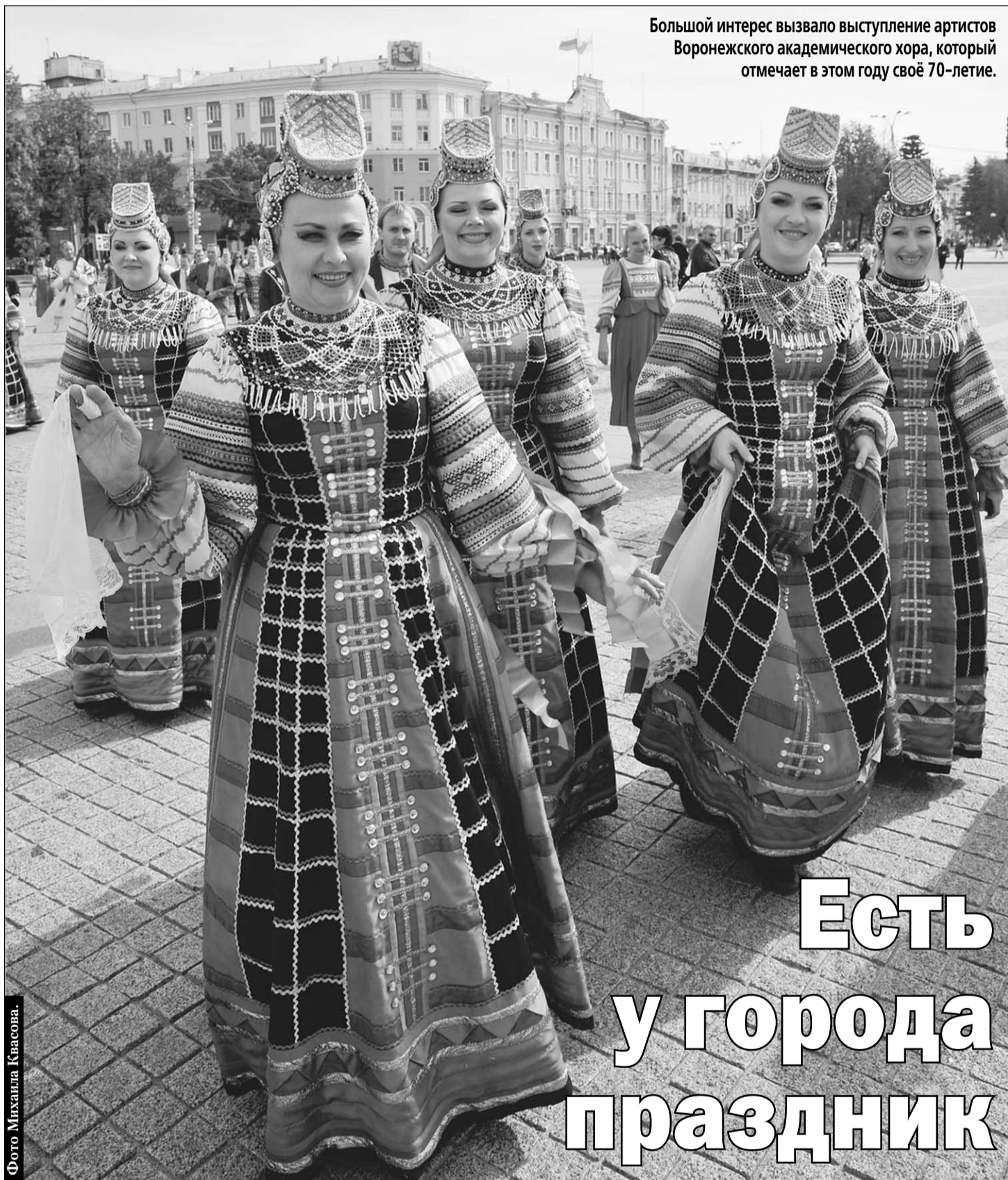
Большой интерес вызвало выступление артистов Воронежского академического хора, который отмечает в этом году своё 70-летие.