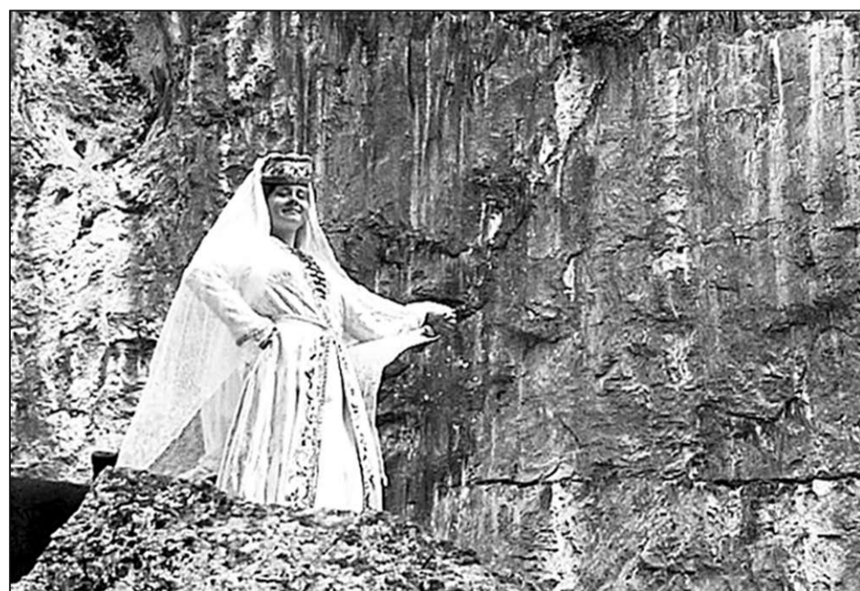
Я примерила наряд абхазской невесты.

По пути к водопаду «Девичьи слёзы» нам поведали старую легенду. Когда-то очень давно здесь жила абхазская царевна. Её голос был звонче горного ручья, танцевала она, словно пташка парит над облаками, к тому же была редкой красавицей и рукодельницей. Как и предполагается во всех сказках, ей очень завидовали местные жители. И вот однажды девушка, какая сгорала от зависти, решила утопить красавицу. Та, узнав об этом, горько заплакала, и её слёзы полились ручьём по горному обрыву. Злодейка выполнила своё намерение. Братья царевны пытались спасти несчастную, но не смогли. С тех пор её горь-