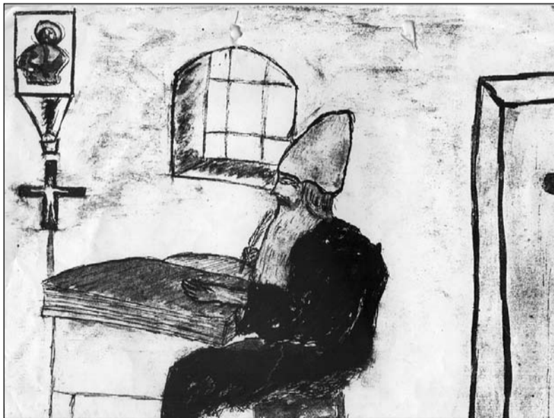
Монах-летописец XVII века. Рисунок автора.