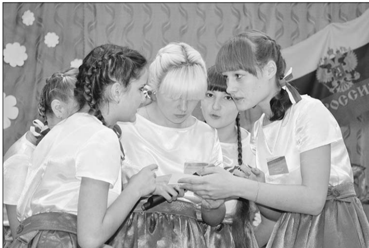
Все вопросы – по зубам команде школы №4.

В лучших кэвээнзовских традициях команды представили свои визитные карточки, домашнее задание. Большинство их показали целые театрализованные представления, в сценарии которых были органично вплетены положения Конституции Российской Федерации, статьи Избирательного кодекса Воронежской области, нормы законов, регламентирующих проведение выборов.