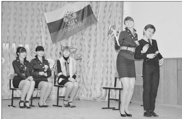
Победители – школа №2.

В полный голос заявили участники очередной районной олимпиады по основам избирательного законодательства. И все настойчивее ударение в этой фразе молодые делают на слове «Мы»