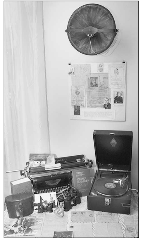
Эти предметы быта стали музейными экспонатами.