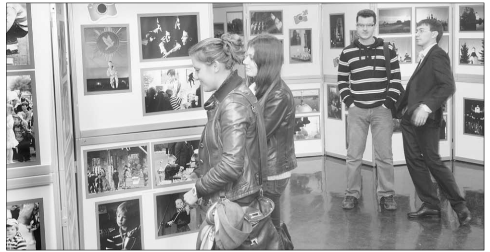
На выставке в университете.

А 27 октября в 17 часов состоится вечер открытых дверей. В этот день педагоги расскажут о студии и покажут работы своих учеников.