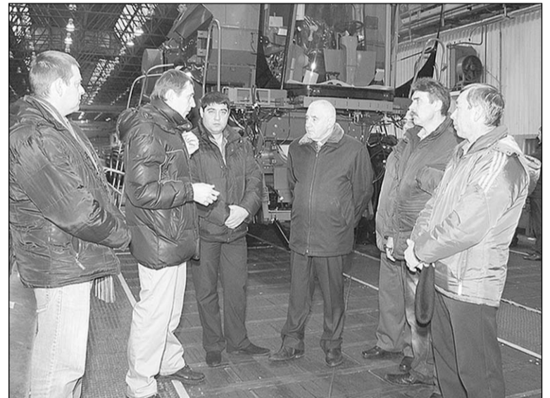
Разговор на сборочном конвейере.

Впрочем, Ростсельмаш выпускает сегодня не только отвечающие самым строгим запросам профес-