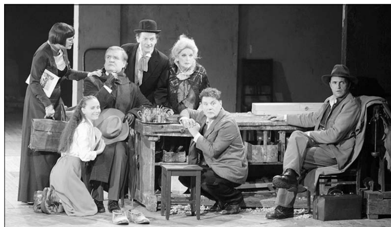
Спектакль «Дядя Ваня» театра имени Евгения Вахтангова на втором Платоновском фестивале.