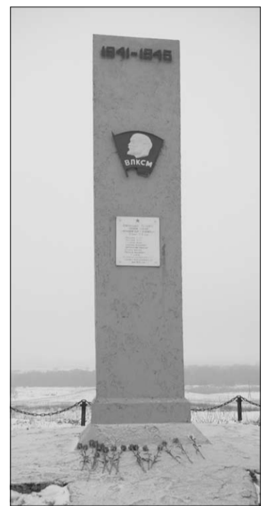
Памятник комсомольцам села Марьевки, павшим на завершающем этапе Острогожско-Россошанской операции.

Прощаясь, руководители делегаций Алексеевки, Острогожска и Россоши так и договорились: наладить и поддерживать социально-культурные связи, и не только по поводу памятных дат.