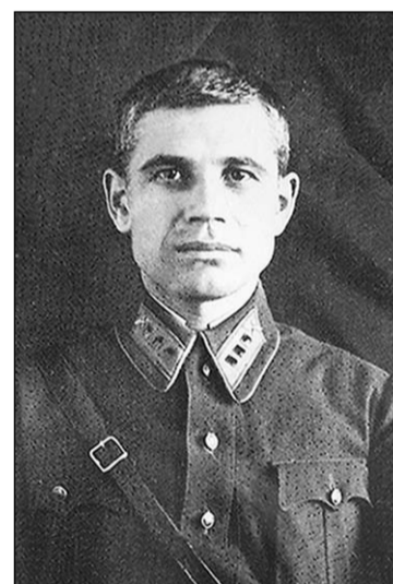
Борис Дурницкий перед началом Великой Отечественной войны.