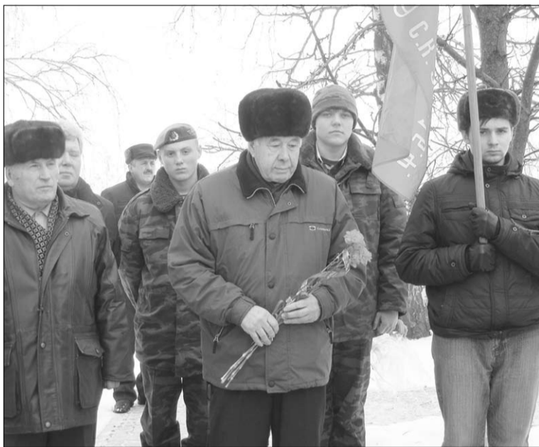
Воронежцы поклонились советским солдатам на белгородской земле.