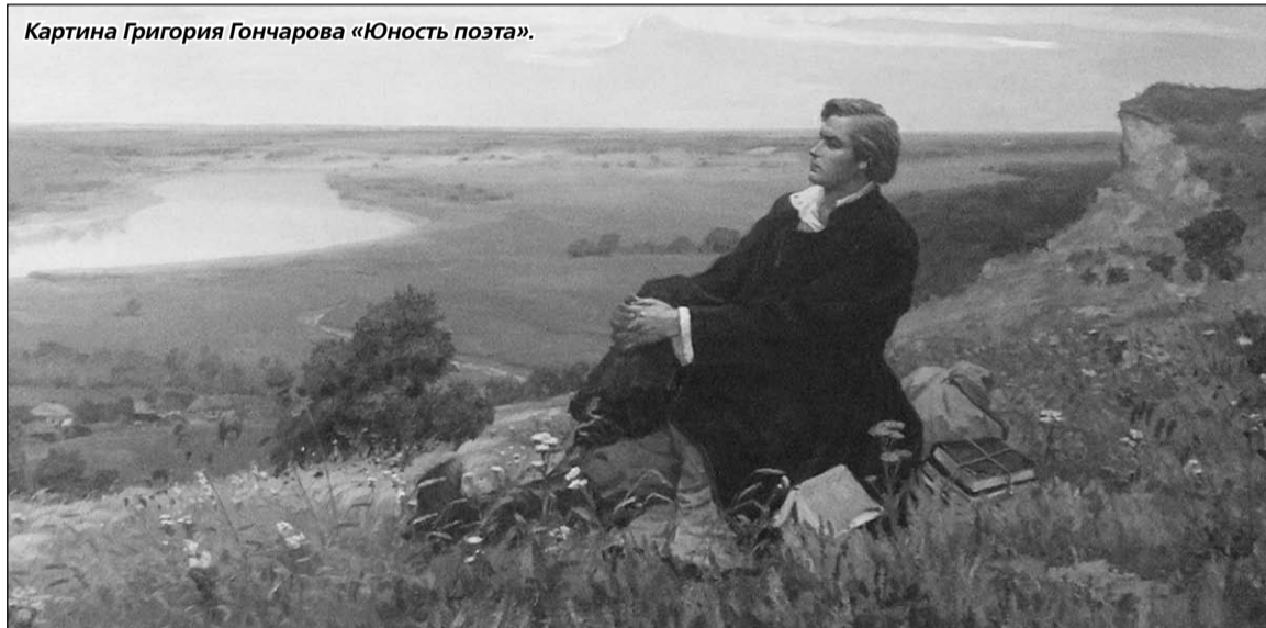
Картина Григория Гончарова «Юность поэта».

К сожалению, в самые последние годы жизни навалившиеся болезни и резко ухудшившееся материальное положение вынудили художника около полусотни своих картин (и далеко не самых худших!) продать за рубеж. А покупали их западные ценители весьма охотно. Таким образом, какую-то часть творческого наследия живописца воронежцы уже больше никогда не увидят. Но даже то, что осталось, вполне даёт представление об истинном таланте художника Г.А. Гончарова.