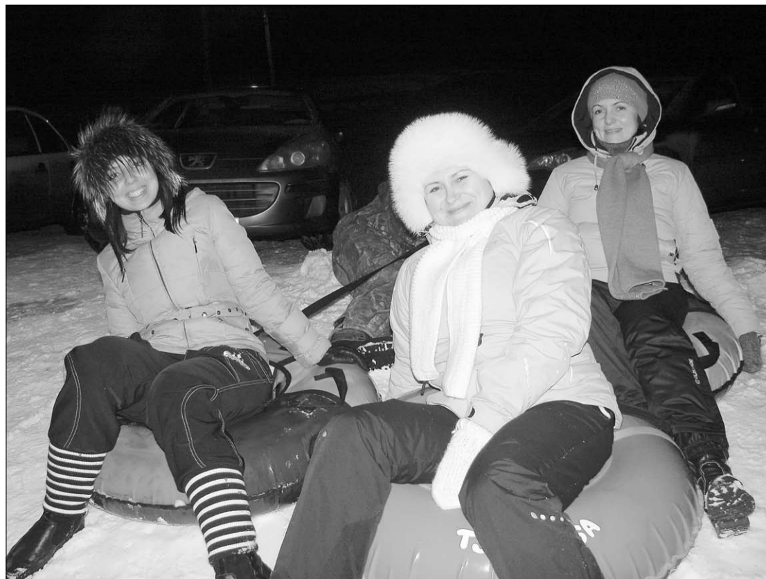
Зимние забавы оказались по душе не только детям.