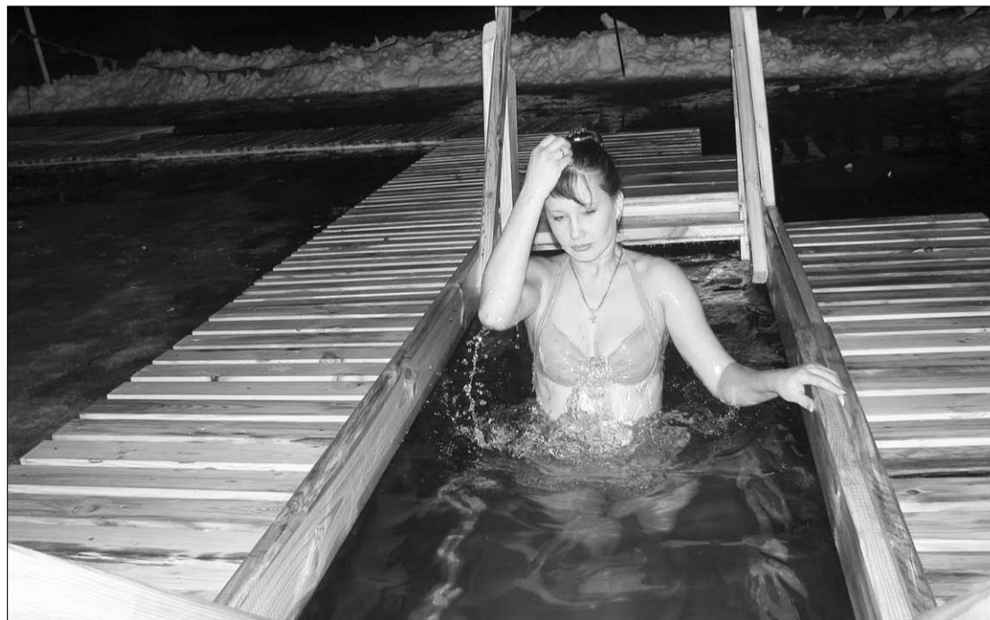
На Крещение в купели окунулись десятки каменцев.

В Каменке создают ландшафтный досуговый центр