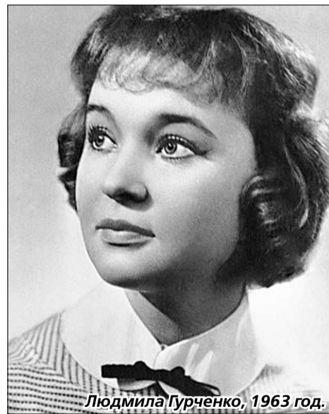
Людмила Гурченко, 1963 год.

В конце 1950-х — начале 1960 годов Людмила Гурченко снималась не часто, но запоминающе, демонстрируя свои ярко выраженные (в том числе и музыкальные) способности. Фильмы «Девушка с гитарой», «Балтийское небо», «Роман и Франческа», «Гулящая», «Укротители велосипедов», «Рабочий посёлок», «Строится мост» — упорчили за ней славу неординарной молодой исполнительницы, обладающей не только опереточным,