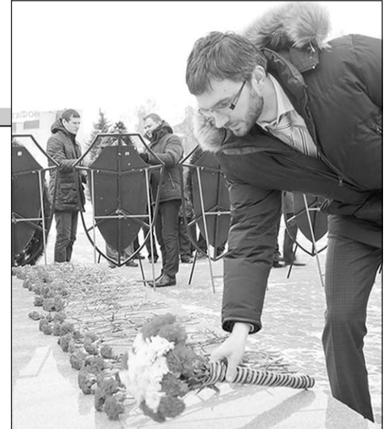
К Вечному огню.

Когда в сорок втором фашисты приступили к операции по захвату Воронежа, перед ними стояла задача: взять город за два-три дня и не задерживаться на Воронежском направлении более недели. Но гитлеровское командование просчиталось. Почти семь месяцев шли ожесточённые бои за город. Линия фронта прошла по Воронежу, однако фашистам так и не удалось захватить его полностью – левый берег остался в руках советских войск. Утром 25 января 1943 года наши войска очистили всю правобережную его часть, и на балконе гостиницы «Воронеж» бойцы 60-й армии водрузили Красное знамя освобождения.