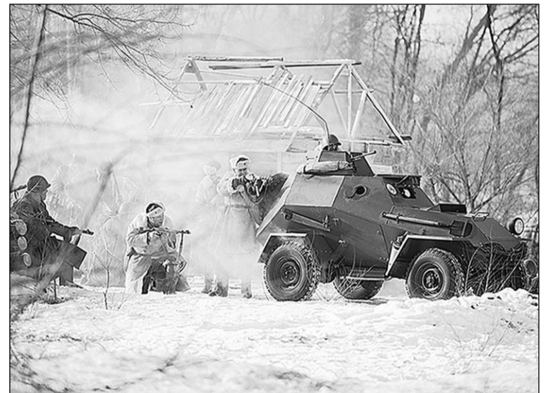
Реконструкция – серьёзная работа.

с транспортными трудностями. К началу военно-исторической реконструкции на Ленинском проспекте образовалась масштабная пробка. Люди с детьми выходили