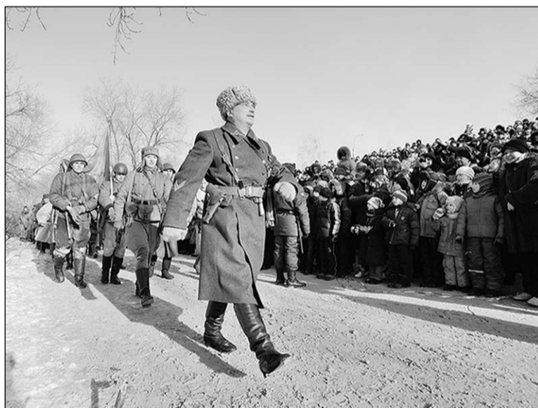
«Сражение» сыграли, а радость – нет.

В день освобождения города от фашистов – 25 января – на площади Победы состоялась торжественная церемония возложения венков к Вечному огню на могиле Неизвестного солдата. Колонну официальных делегаций органов власти, ветеранских и общественных организаций, силовых и правоохранительных структур возглавил губернатор Алексей Гордеев. А вечером над Воронежем прогремел праздничный салют.