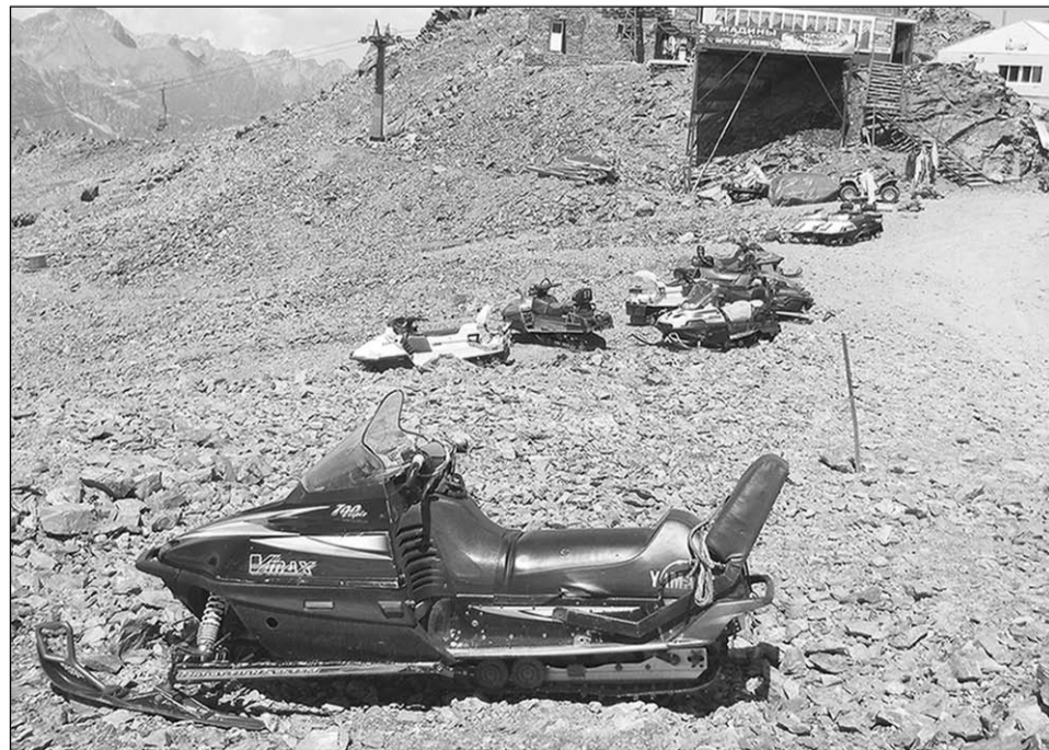
«Сервис» для туристов.