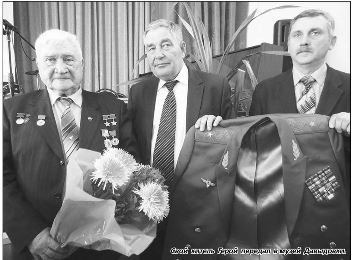
Свой китель Герой передал в музей Давыдовки.

Дважды Герой Советского Союза, лётчик-космонавт Анатолий Филипченко встретил день своего рождения в кругу земляков – острогожцев и лискинцев