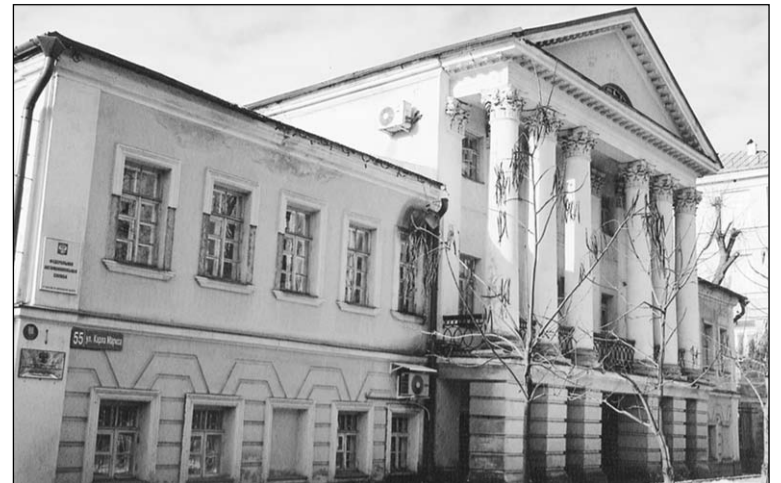
В этом здании на улице Карла Маркса и располагался Дом пионеров.