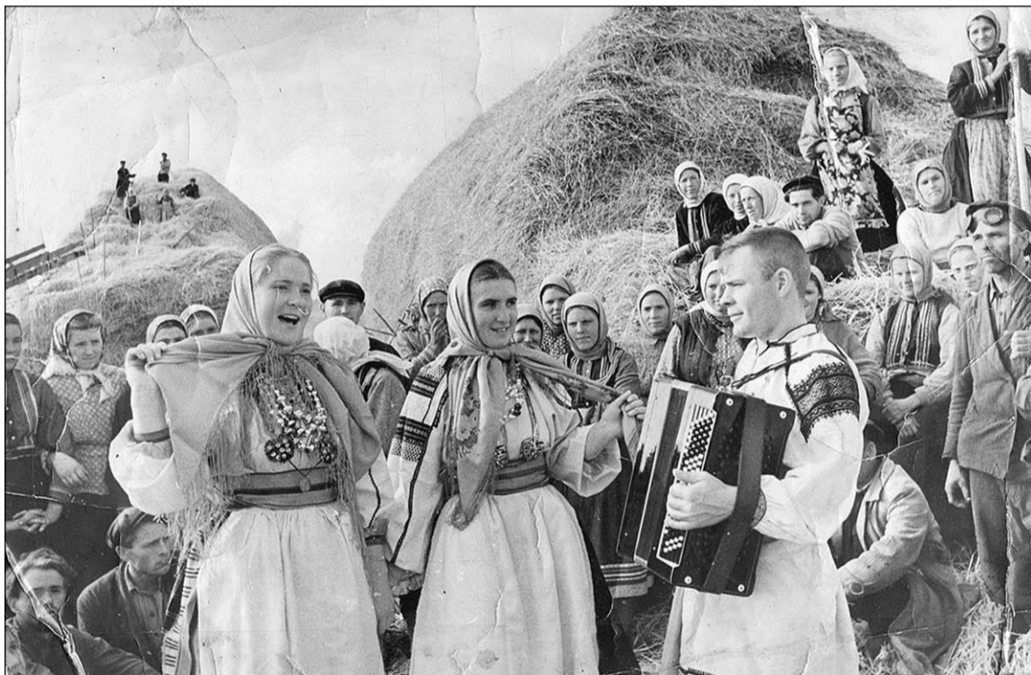
Концерт в поле среди скирдовальщиков в Подсереднем (1950-е годы).

Расслоение по земельным наделам было очень заметным. До пяти десятин находились в пользовании 49 подворий, от 5 до 15 десятин – 53 подворий, от 15 до 25 – 16 подворий, от 25 до 50 – 9 подворий. Самым многоземельным являлось одно подворье, имевшее свыше 50 десятин, но в нём проживало 15 мужчин и 11 женщин. По преданию, главой семьи был Ушаков. Безземельными оказались три подворья. Не все хозяйства могли прокормиться со своего земельного надела, поэтому брали у односельчан участки во временное пользование. В аренде находились 402 десятины, которые взяли за плату 72 хозяйства.