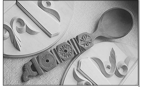
От работ бобровского мастера как будто веет теплом.