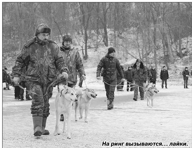
На ринг вызываются... лайки.