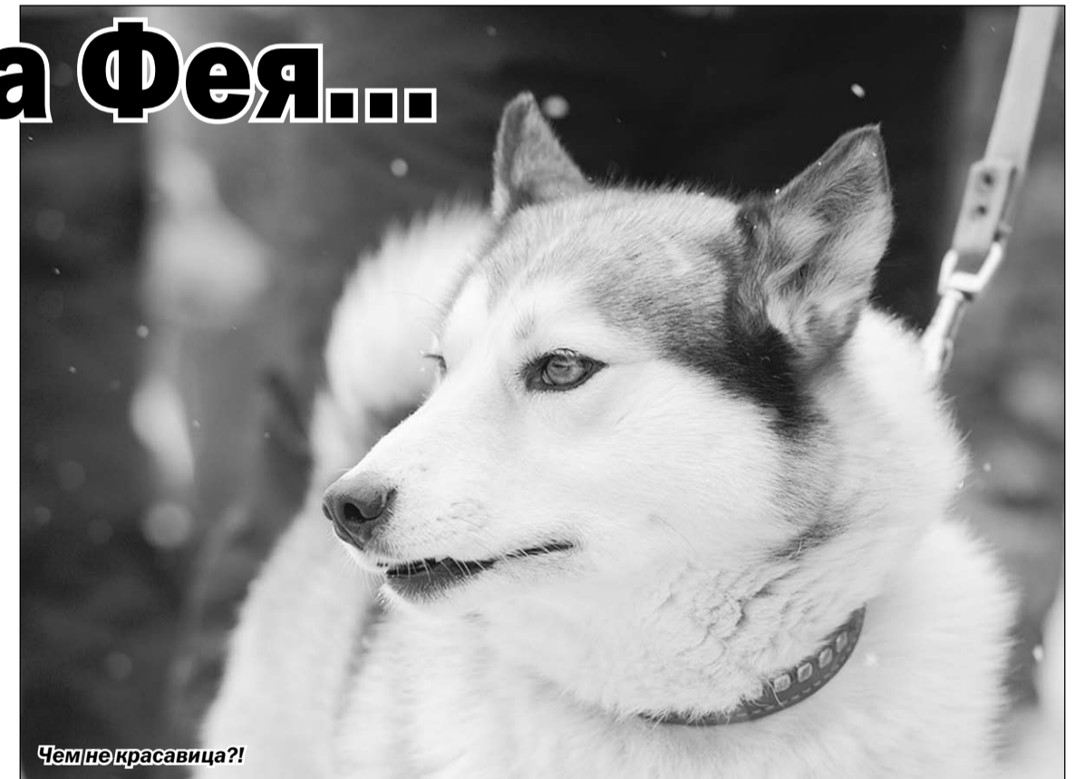
Чем не красавица?!