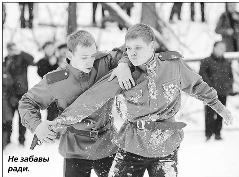
Не забавы ради.