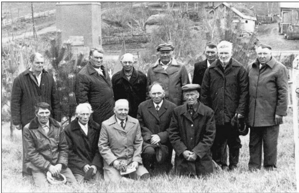
Ветераны войны у памятника погибшим фронтовикам (Новоказанка, 80-е годы).

Первый колхоз в Ново-Михайловском сельсовете Орского района, к которому относился и хутор Ново-Казанский, был создан в 1929 году и получил название «Красное знамя». Его