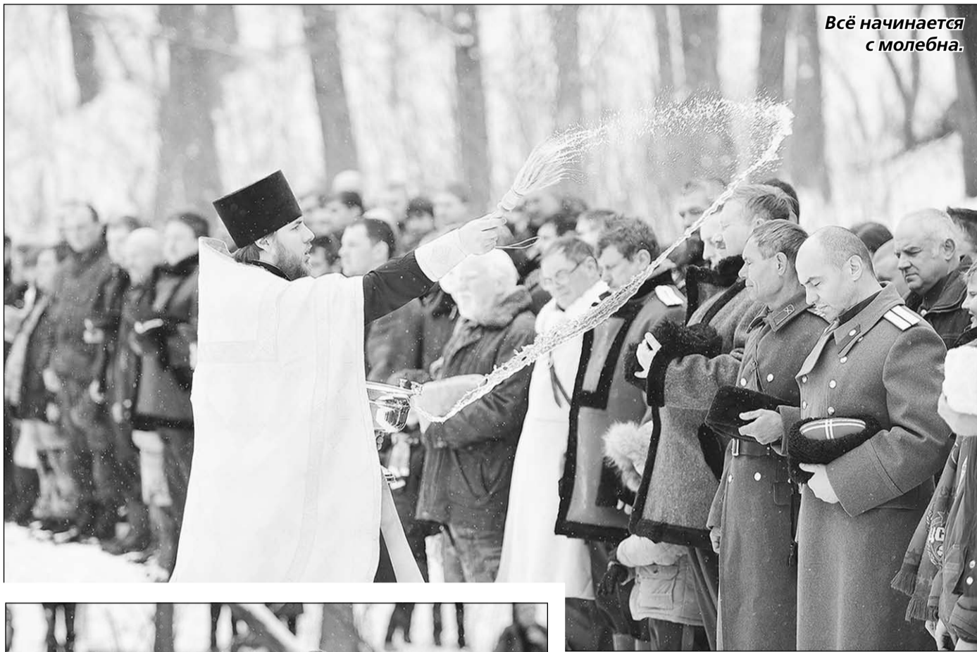
Всё начинается с молебна.

Ну, и какой же праздник без угощений?! В парк привезли настоящую полевую кухню. Все желающие могли отведать кашу с пылу, с жару и чайком согреться.