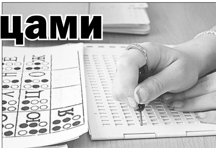
Гости библиотеки знакомятся со шрифтом Брайля.

небольшое стихотворение. Для этого нужно иметь специальную таблицу, в которой напротив каждой буквы алфавита стоит схема этой буквы по Брайлю. Стоит отметить, что схемы для накалывания текста и для его чтения - зеркальные, так как написание мы производим с оборотной стороны листа, а чтение - слицевой. Для удобства лист кладется под трафарет с прямоугольниками равной величины,