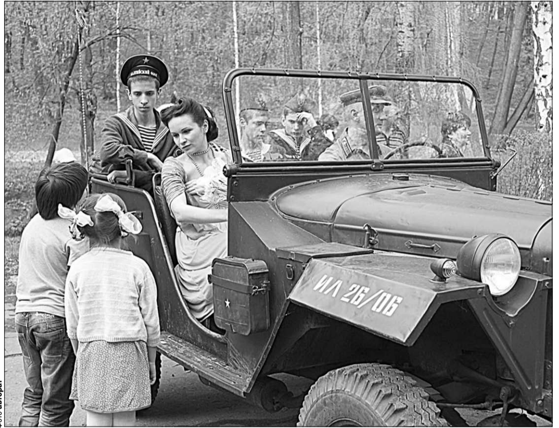
Эх, путь-дорожка фронтовая...