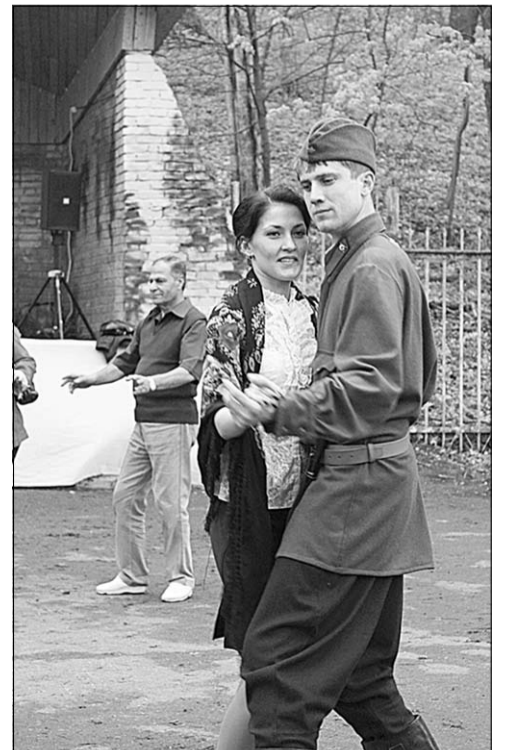
Под звуки нестареющего вальса...