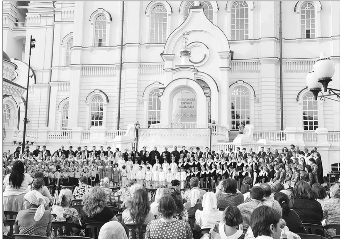
Гимн и Тропарь Кириллу и Мефодию исполнил объединённый хор в двести голосов.

Проходившая в День славянской письменности и культуры Воронежская хоровая Ассамблея не только впечатлила, но и укрепила идею возрождения отечественных хоров