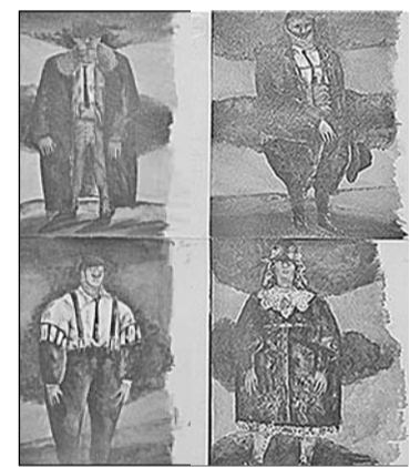
Эскизы к спектаклю «Носороги».