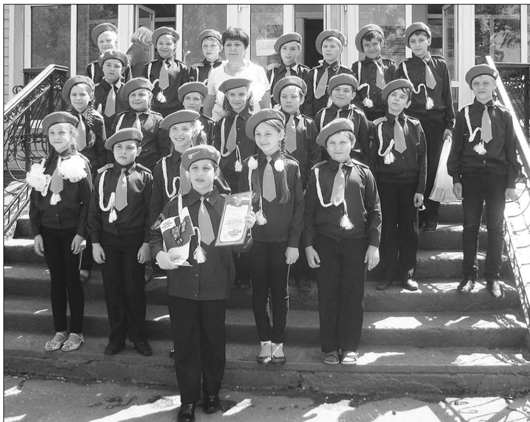
Отряд спасателей из 4«А» - победители смотра-конкурса среди младших классов.