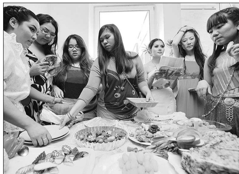
Группа из Таиланда подходит к делу основательно.

– Сначала мы смешиваем фасоль, кокосовое молоко и сахар. Потом вылепливаем из полученной массы «маленькие штучки» в форме папайи, манго, красного перца. На самом деле можно всё, что угодно вылепить. Затем красим пищевыми красками на основе трав – они очень полезны, мы специально привезли