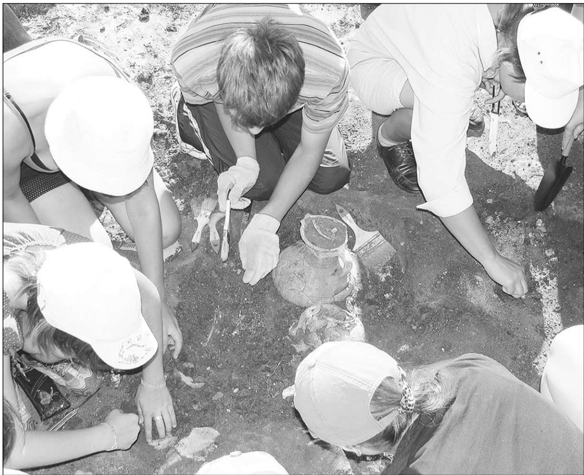
Расчистка погребения – дело ответственное!

Областной слет, конечно, это другой уровень, более высокий.