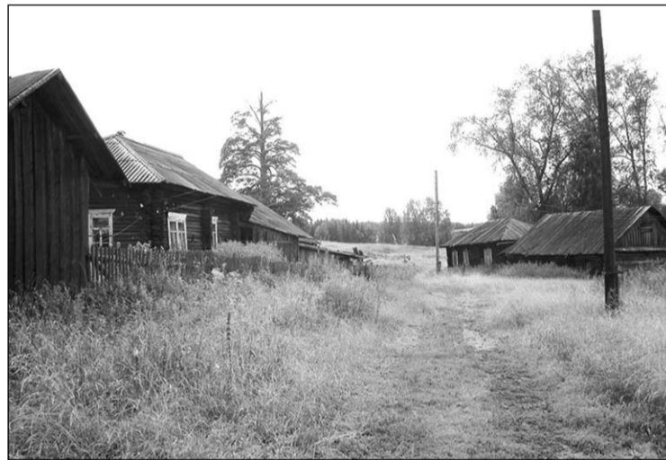
«Матушка-земля словно втягивает бывшее селение в себя, хоронит его в глубь земли, как в могилу, чтобы скрыть мерзость запустения, опустения и разрухи».

Хутора подтачивать разругалась в конце сороковых – в начале пятидесятых годов, когда началось укрупнение колхозов. Вроде потом как-то приспособились, притёрлись, а тут семидесятые: хутора, деревеньки и вовсе объявили перспективными, оставив умирать, уже окончательно.