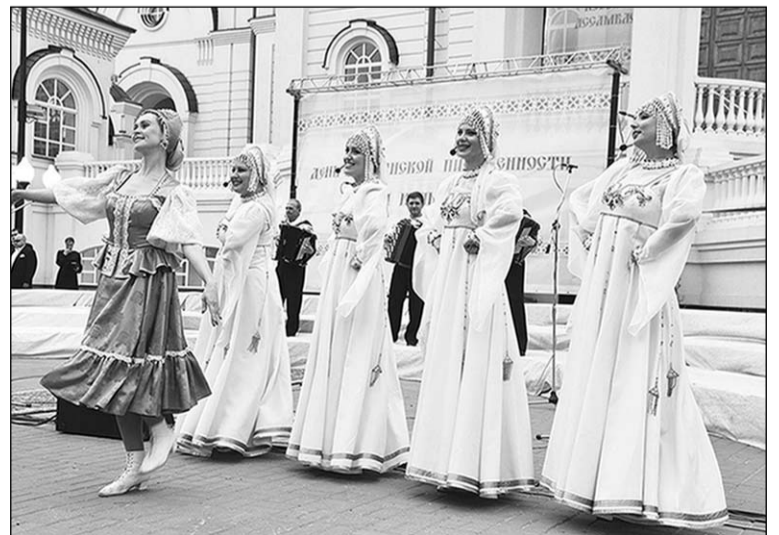
Выступает ансамбль «Воронежские девчата».