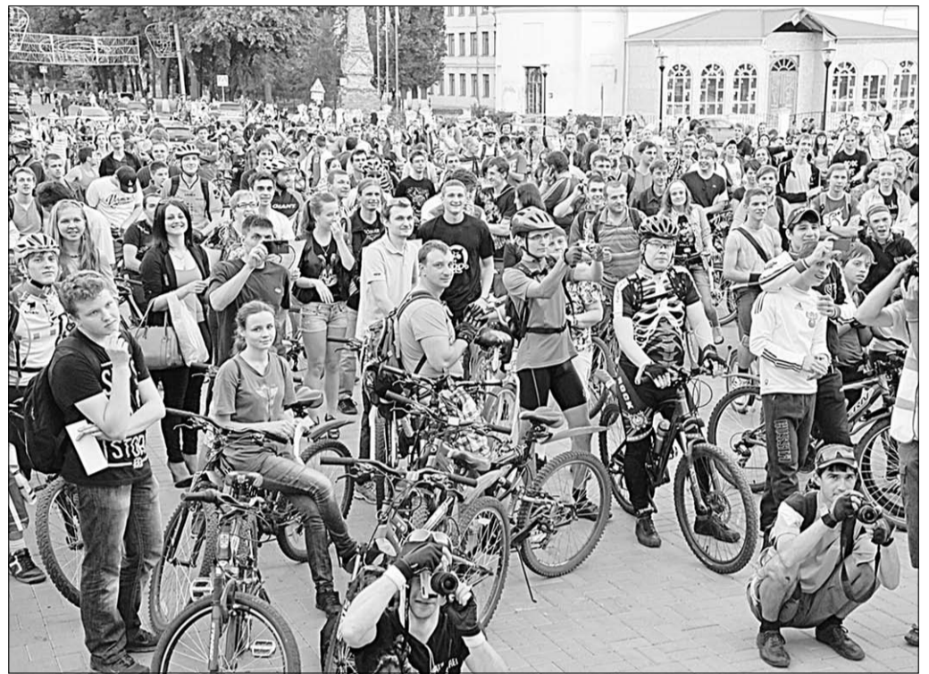
Воронежские велосипедисты явно заслуживают внимания и своего достойного места в городе.

В Воронеже прошла третья велоночь, в которой участвовала и корреспондент «Коммуны»