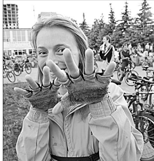
Куда бы ни «смотрела» наша фотокамера – повсюду светились улыбки.

От «Юбилейного» колонна двинулась в сторону вокзала, оттуда – к «Работнице». Далее – в сторону