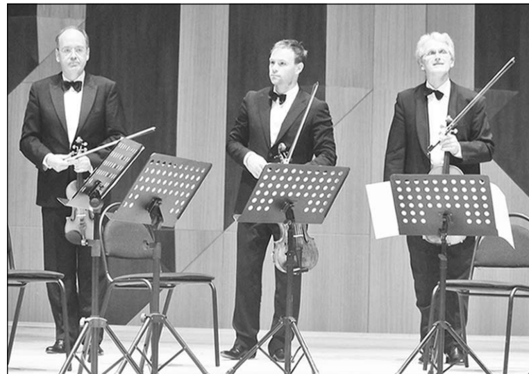
Берлинский оркестр в Воронеже.

Программа, ориентированная на ранние опусы, не могла не обнаружить в них черты сходства. Прозрачность фактуры, ясное ощущение формы, структурную чёткость. Все эти качества музыки естественным образом пролонгировались на исполнение, к тому же Шенберг потребовал от музыкантов еще и виртуозности, их хорошего слышания полифонии, а Мендельсон – непосредственности и изящества. За годы работы в знаменитом оркестре музыкантов выработалась хорошая привычка – быть успешными и востребованными. Ведь посещать симфонические и камерные концерты в Германии считается престижным. Это – как норма приличия.