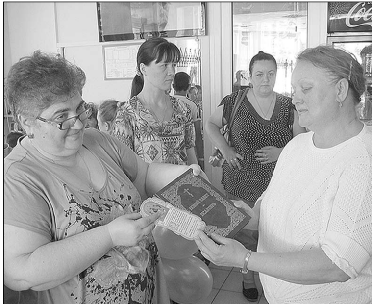
Награждение победителей и участников фестиваля.

Приятно и то, что на этот раз у нас как никогда много было волонтеров и спонсоров, которые помогли нам успешно провести фестиваль. Это Воронежская и Борисоглебская епархия, дирекция спорткомплекса «Звёздный», учащиеся Воронежского медицинского колледжа. Всё это даёт надежду на то, что наш фестиваль с каждым годом будет всё интереснее, а число его участников будет постоянно расти. А значит, наша главная цель – качественное улучшение жизни инвалидов – будет достигнута.