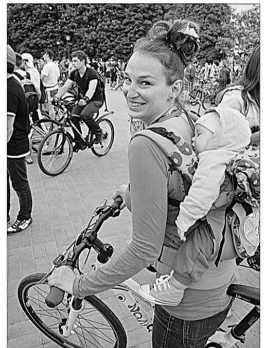
В эту ночь почитатели двухколёсного транспорта показали, что ему покорны все возрасты.

«Динамо» и по Северному мосту, к Ленинскому проспекту. Велосипедисты приветствовали зрителей и автомобилистов, свистели и улюлюкали, словом, поддерживали боевой настрой. Проехав Ленинский проспект, колонна свернула на Вогрэзовский мост, оттуда по набережной – на Адмиралтейскую площадь, где был долгожданный финиш.