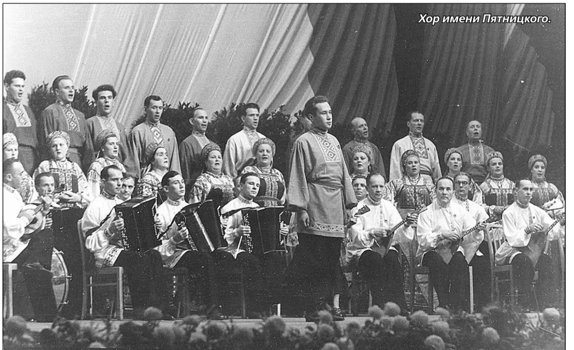
Хор имени Пятницкого.