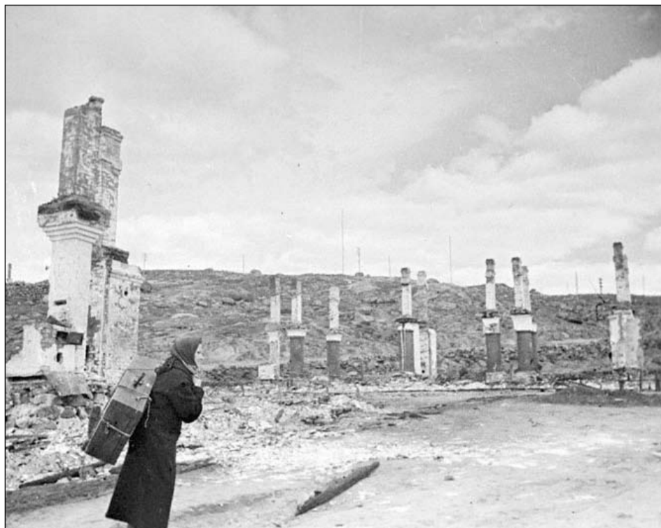
И всё-таки люди, возвращаясь к пепелищам родных домов, начинали жить снова.