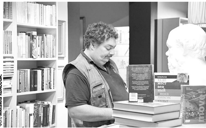
Дмитрий Быков в книжном клубе «Петровский».

Отмечая, помимо прочего, что «одно из главных достоинств этого произведения состоит в том, что автор сумел языком поэзии изобразить органическое, чувственное, естественное отвращение народа к троцкизму». Значитель-