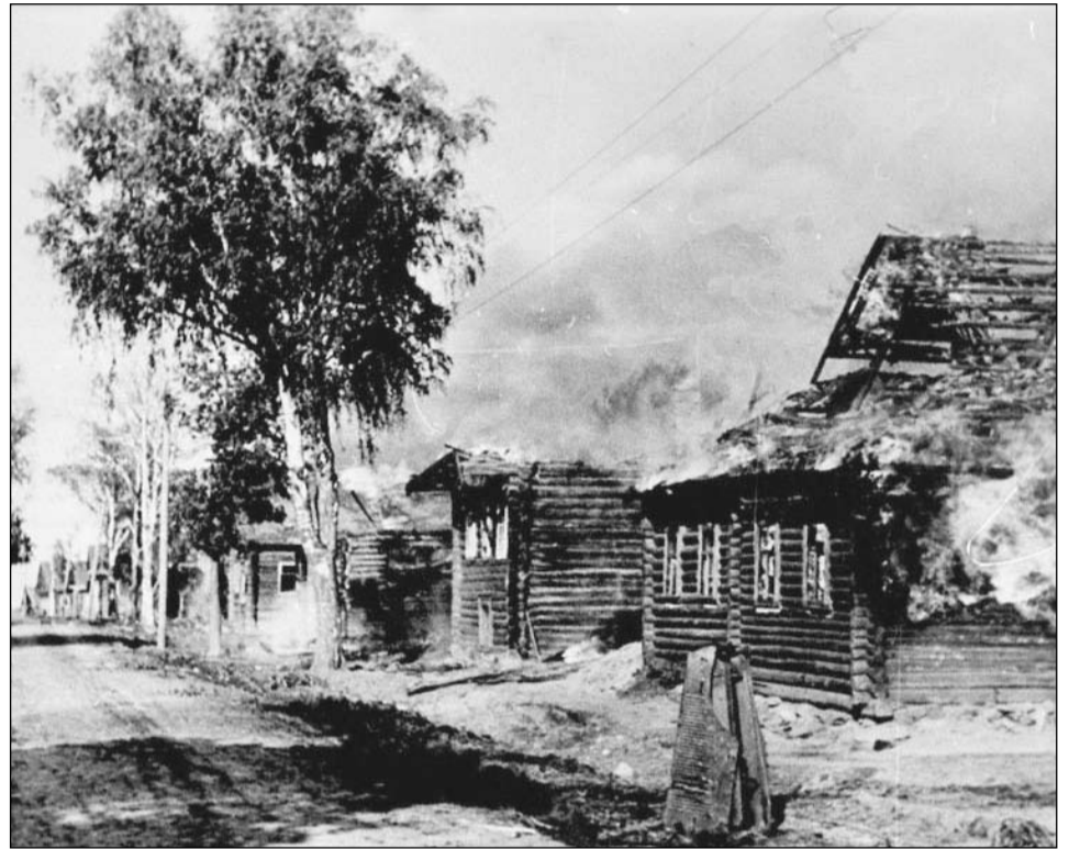
Русские деревни и оставшиеся в них старики, женщины и дети сполна познали зверства оккупантов.

Не менее страшной и жестокой была дорога урывцев в изгнание. За малейшее на-