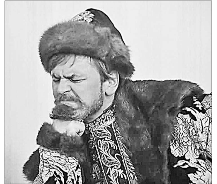
Юрий Яковлев в роли царя в фильме «Иван Васильевич меняет профессию»

Обладая широким артистическим диапазоном, тонким чувством жанра и стиля, редкой аристократичностью манер, незабываемым голосом, актёр с бле-