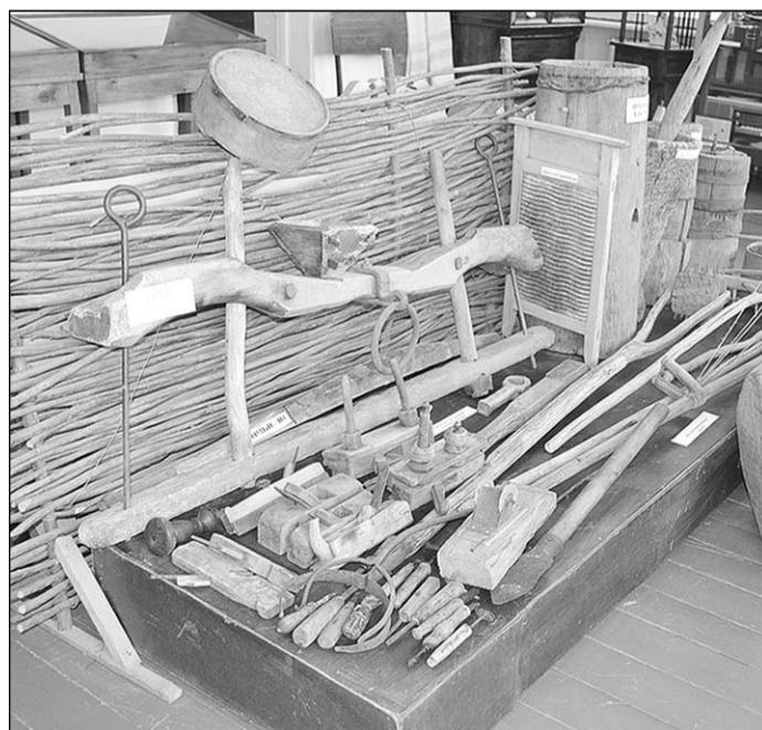
Вот так выглядят некоторые экспозиции Ольховатского музея.