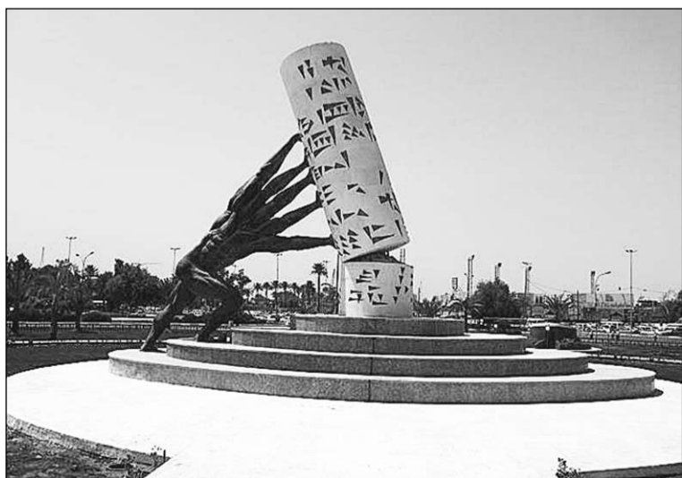
Памятник в Багдаде, посвященный восстановлению Ирака.