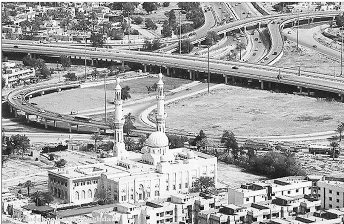
Известная мечеть Ат-Табуль, находящаяся на выезде из Багдада по дороге в аэропорт.

И вот наступает очередная волна выборов. Нынешней весной, к примеру, голосующих было заметно меньше, чем во время предыдущих. Люди перестали верить тем, за кого голосуют, потому что они не оправдывают их доверие. Улицы песярят предвыборными плакатами, кандидаты распространяют среди соседей, знакомых и родственников свои визитки. Многие просто покупают голоса: за деньги, за еду (устраивают бесплатные обеды, приглашают людей, которые потом