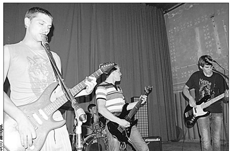
«Сигма» - это рок.

Да и профессионально, видно сразу, ребята выросли на порядок: на «разогрев» между песнями уходит времени совсем немного, и я едва