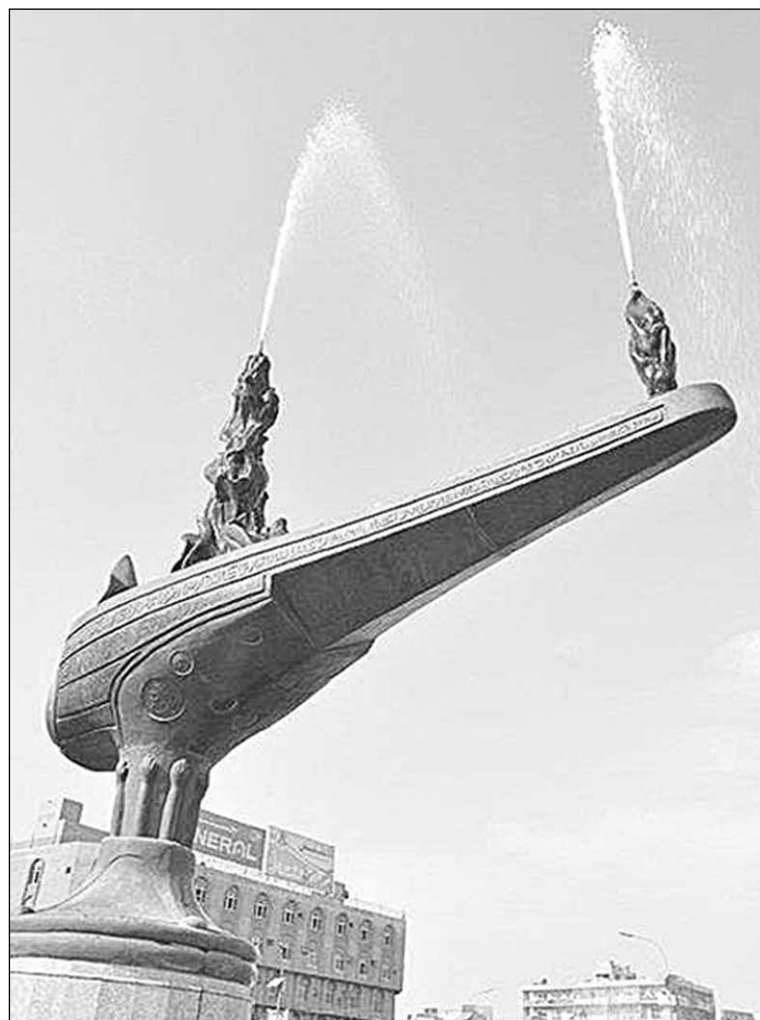
В Багдаде много скульптур, посвященных персонажам сказок «1001 ночи», выполненных в виде фонтанов. Это «Волшебная лампа Аладдина».

Иногда спрашиваю, как можно просто сидеть? В ответ слышу: «А что делать?». Если в семье есть автомобиль, то редко кто из членов