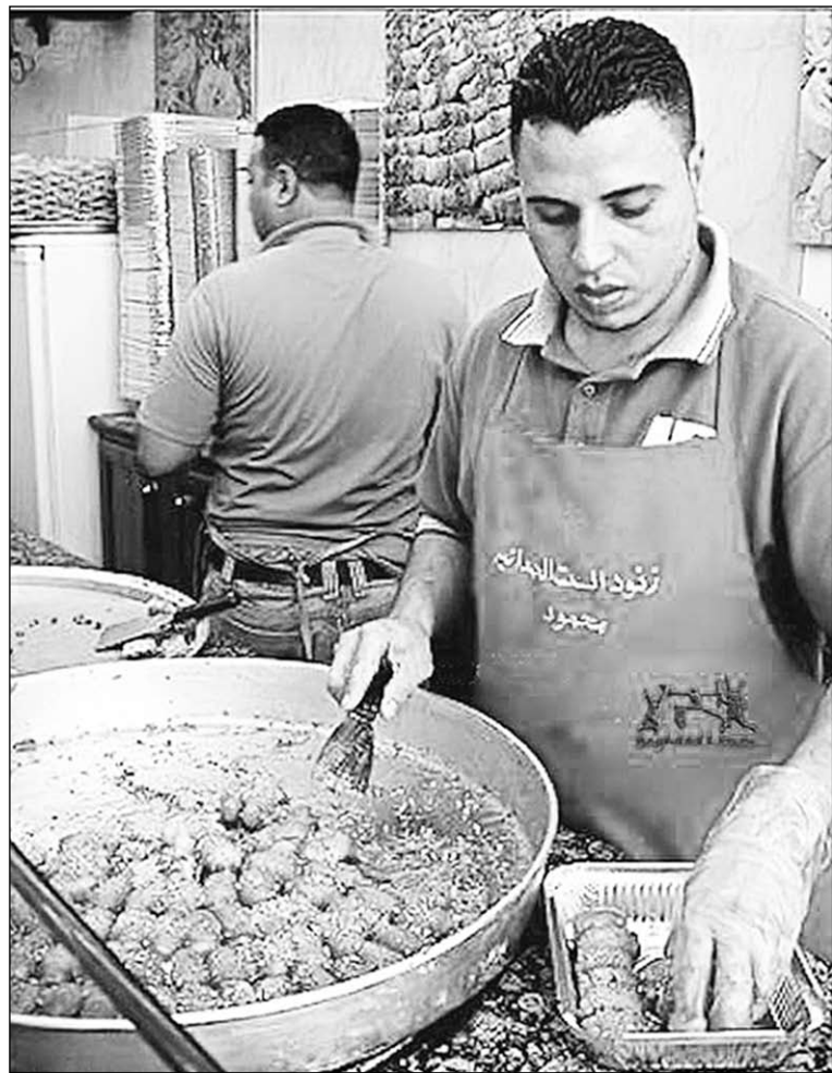
В Ираке большой выбор сладостей на любой вкус и кошелек. Основные составляющие их – тесто, орехи, сироп.