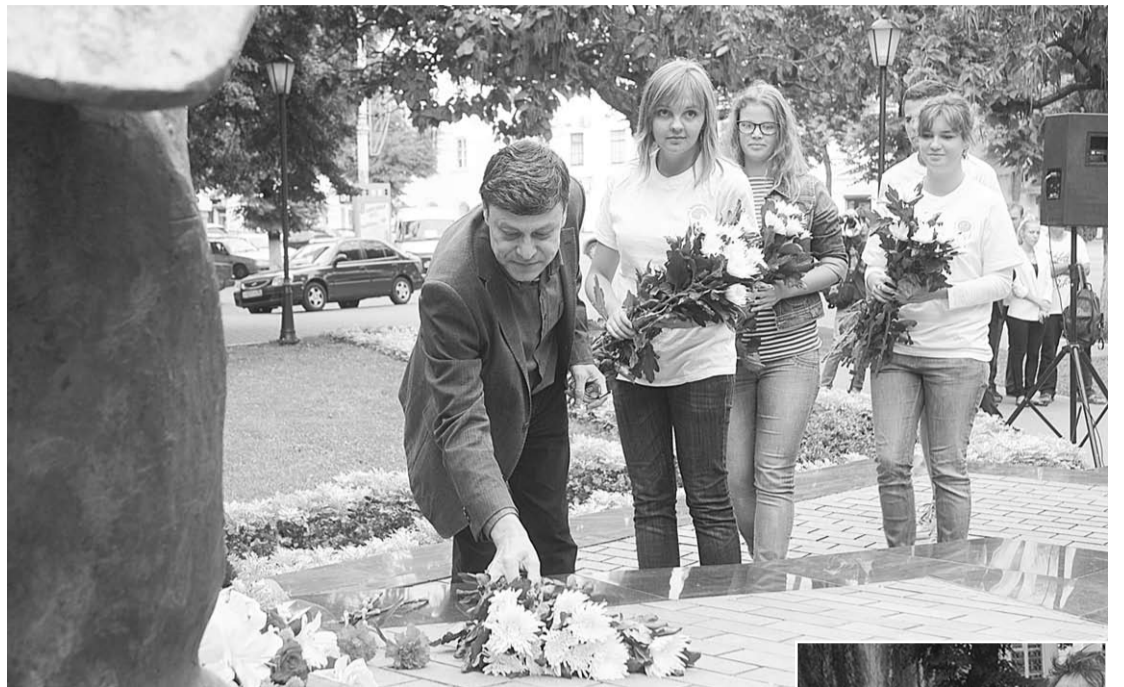
Присутствовавшие возложили цветы к памятнику писателя.