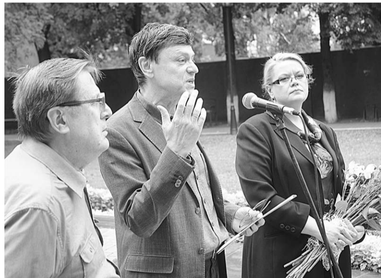
«Мы собрались здесь засвидетельствовать своё почтение писателю, нашему земляку».