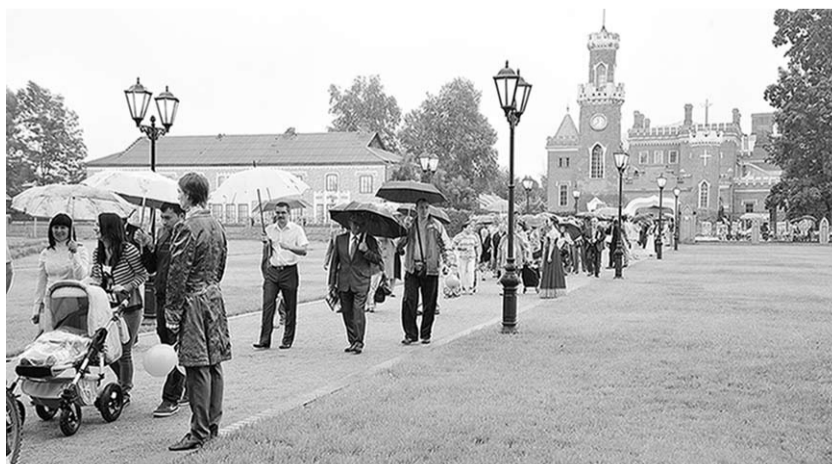
Многочисленные гости посетили обновлённый парк.