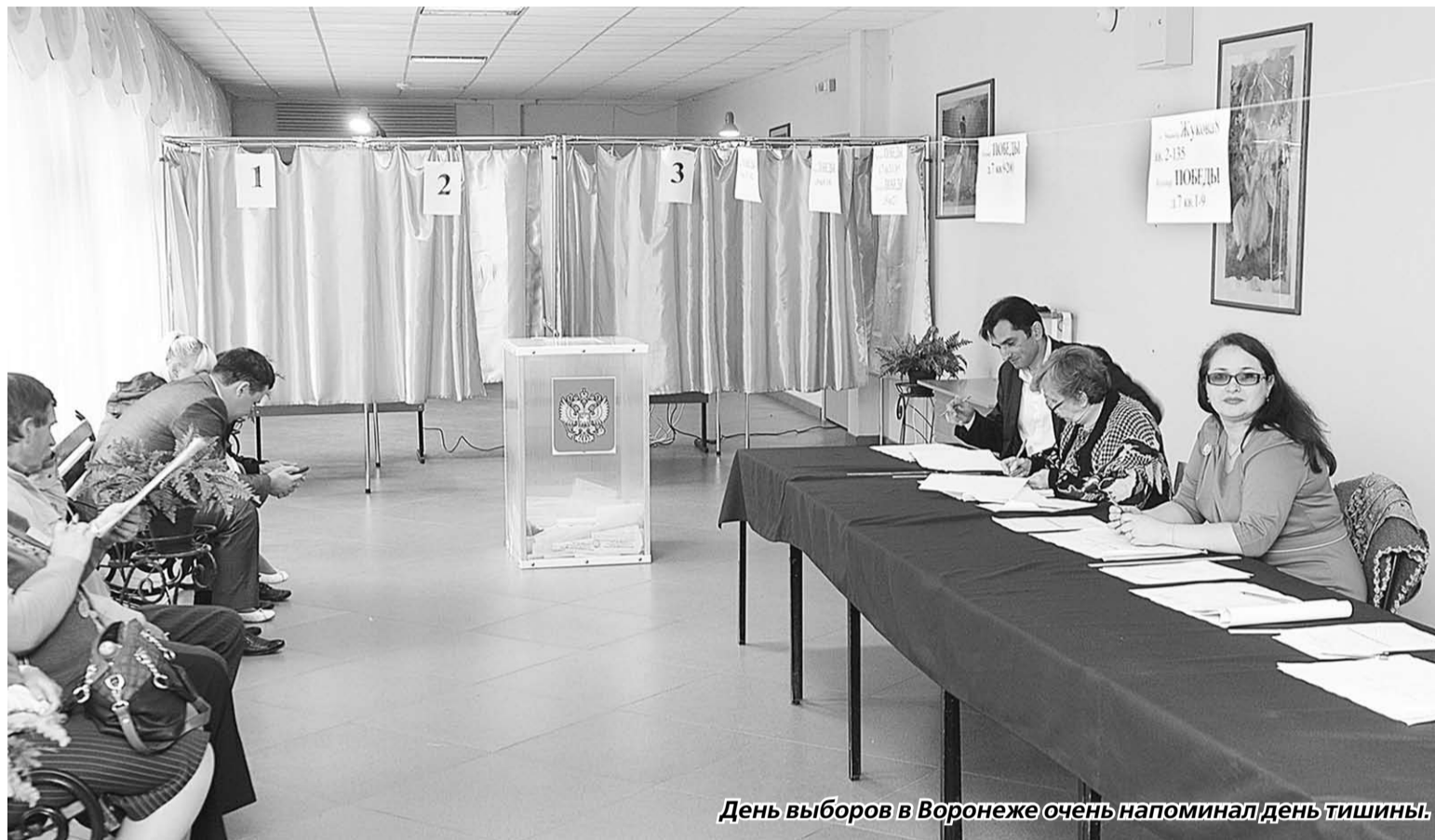
День выборов в Воронеже очень напоминал день тишины.

Почти 77 процентов воронежцев не пришли на избирательные участки