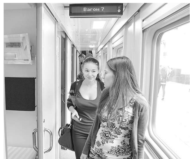
Экскурсанты сожалели, что этажность не добавила пространства.

Федеральная пассажирская компания организовала демонстрационный рейс поезда по маршруту Москва-Адлер с остановками в пяти городах России, и Воронеж стал вторым на этом пути. К тому же наш город является важнейшим узловым пунктом, связывающим север и юг России, что приобретает особое значение в свете приближающихся Олимпийских игр 2014 года в Сочи.