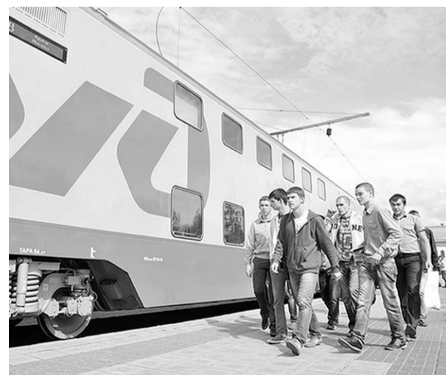
Новые поезда вместительнее обычных в два раза.

Нельзя не заметить, однако, что вместительность таких