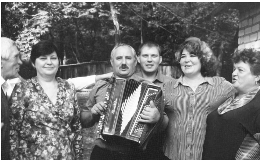
Праздник отметили в Шиповом лесу хорошим настроением и добрыми песнями.