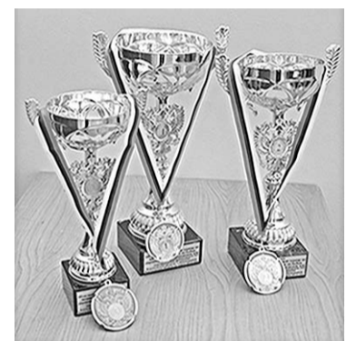
Шахматные битвы за главные призы были интересны и бескомпромиссны.

В ближайшее время комиссиями по пропаганде и сельским шахматам РОО «Шахматная федерация Воронежской области» намечает провести в регионе целую серию доступных массовых соревнований.