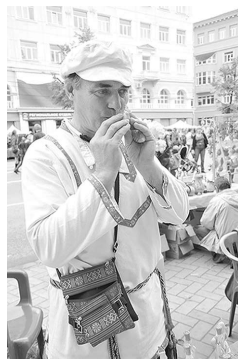
На выставке-ярмарке «Мир игрушечных чудес».

На следующий день фестиваль продолжил свою работу в Воронеже. Возле памятника Митрофану Пятницкому выступали самобытные фольклорные коллективы. Выставка-ярмарка народной игрушки и сувениров «Мир игрушечных чудес» нисколько не затерялась в пёстрой программе Дня города.