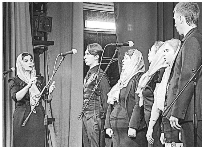
Песня, обращенная к душе.