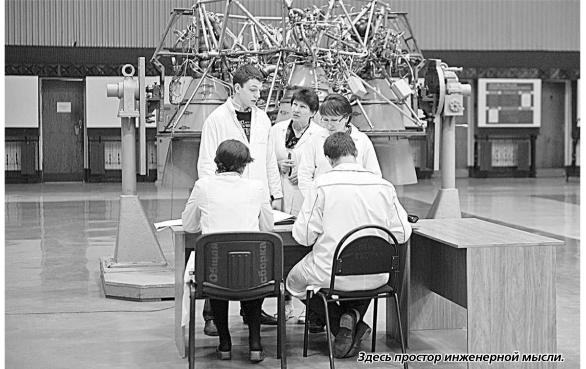
Здесь простор инженерной мысли.

ОАО «Конструкторское бюро химавтоматики» – предприятие, являющееся одним из мировых лидеров по созданию жидкостных ракетных двигателей для космических ракет-носителей и межконтинентальных баллистических ракет