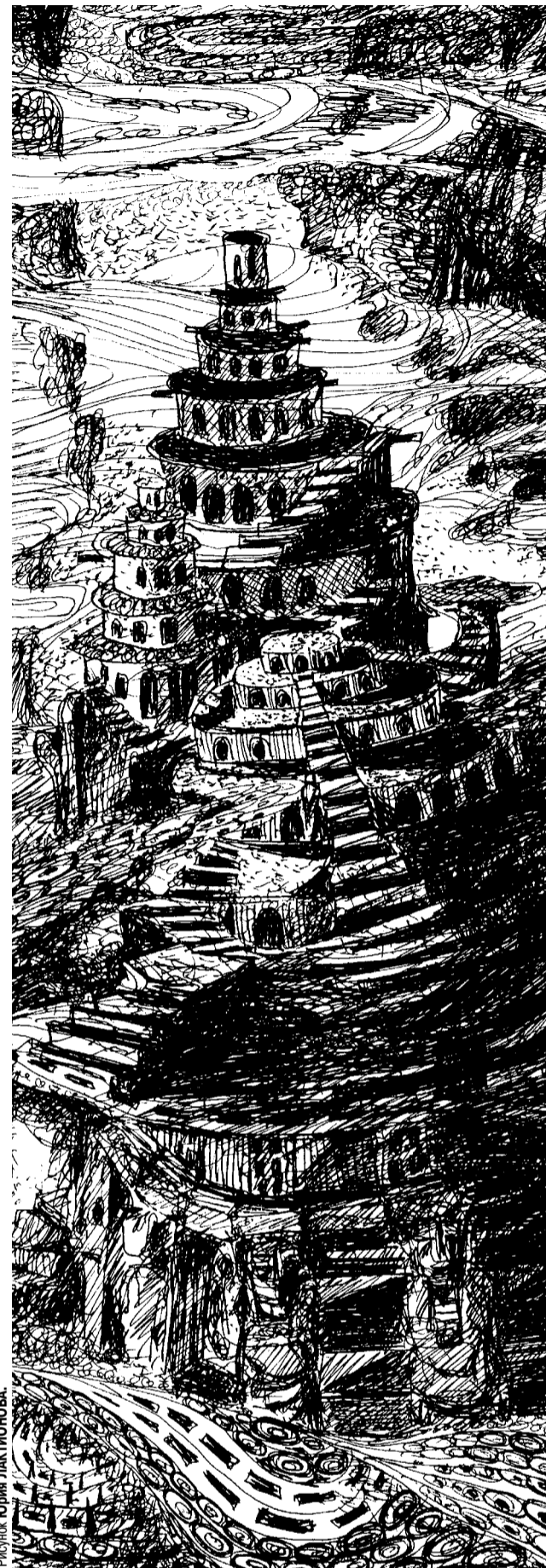
Рисунок Юрия ЛАКТИОНОВА.

- Никого я не губила, - обиженным голосом сказала женщина. - Богом клянусь!