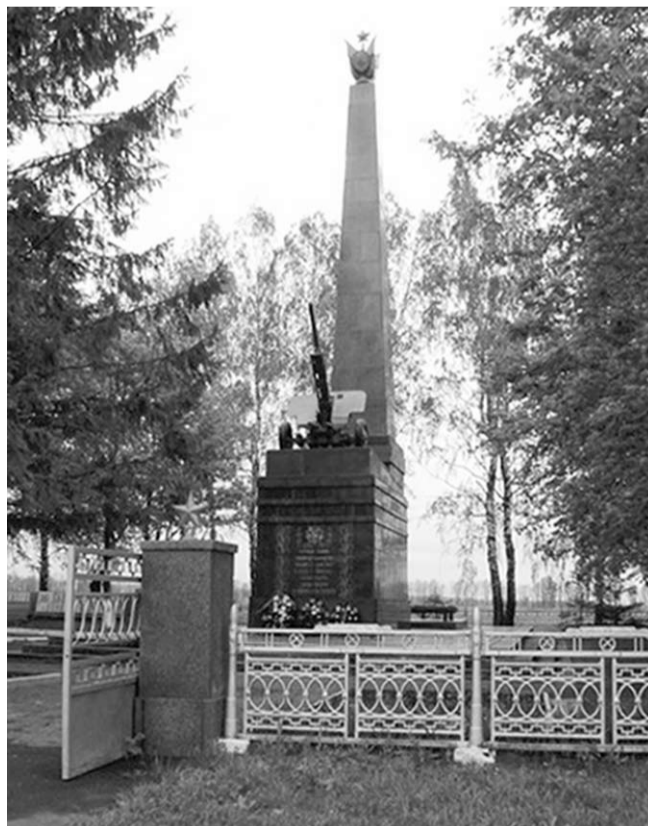
Памятник на Тёпловских высотах.