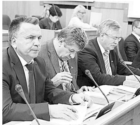
Идёт обсуждение законов.

На заседании областной думы депутатами был утверждён Закон «Об установлении величины прожиточного минимума пенсионера в Воронежской области на 2014 финансовый год»