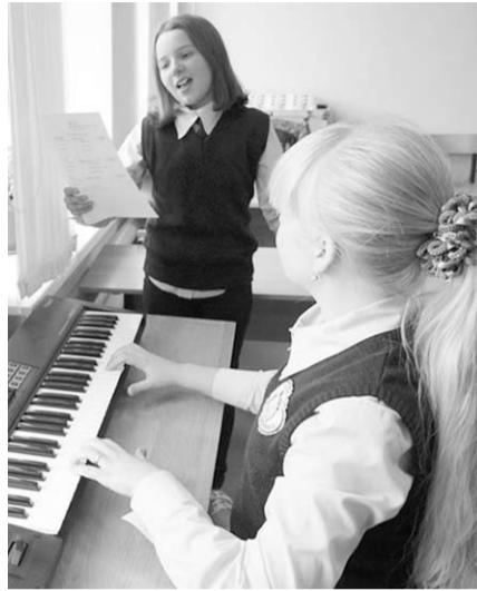
Есть время и на музыку и песни.