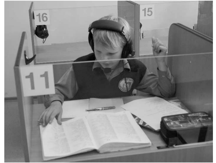
С первого класса – иностранный язык.