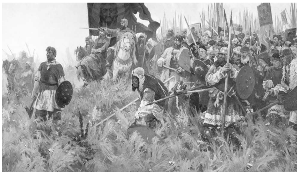
Александр Бубнов. «Утро на Куликовом поле».

Если останемся живы – ради Господа, Если умрем за мир сей – ради Господа!» Эти слова, произнесенные более шести