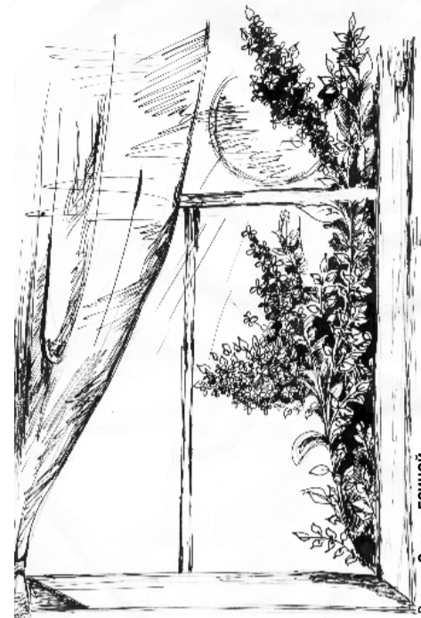
Рисунки Оксаны ЕСИНОЙ.

Как чувствуется в небе поступь Бога! Ах, чья-то жизнь - кузнечик легконогий - Всё попадает Господу под ноги,