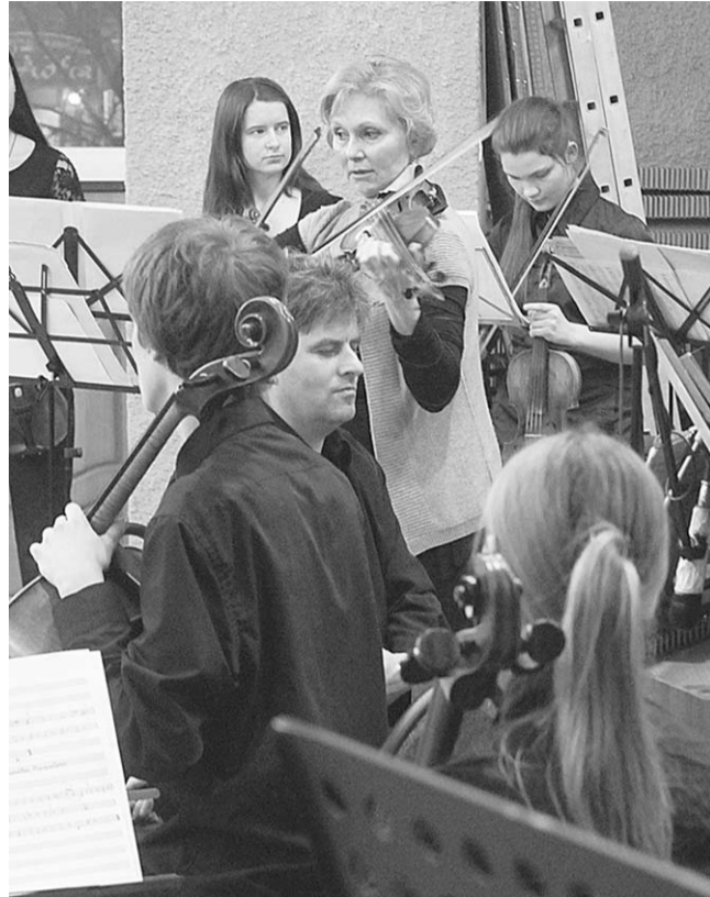
Мастер-класс и выступление в академии искусств скрипачки, народной артистки РФ Татьяны Гринденко.

2002 Первый на Африканском континенте памятник великому русскому поэту Александру Пушкину открыт в столице Эфиопии Аддис-Абебе. Бронзовый бюст работы скульптора Белашова - дар правительства Москвы - установлен в одном из центральных районов города.