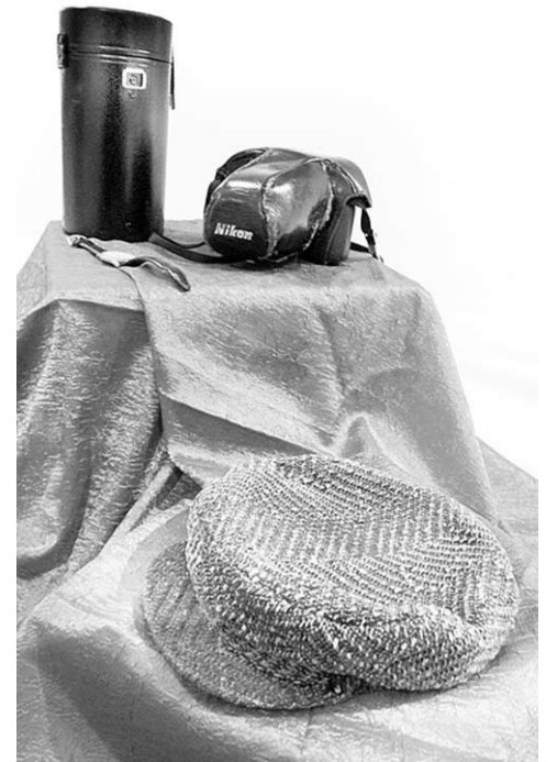
Личные вещи выдающегося журналиста.