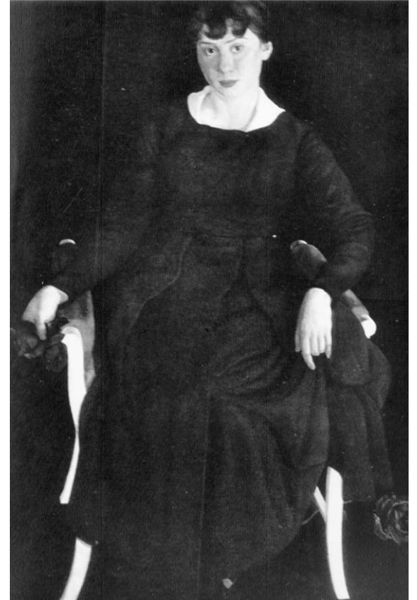
«Портрет жены», 1917г.

События личной жизни Яковлев как бы обряжал в «античные одежды» и воспринимал их сквозь призму мифа: в «Вертумисе и Помоне» ликующая плодоносящая