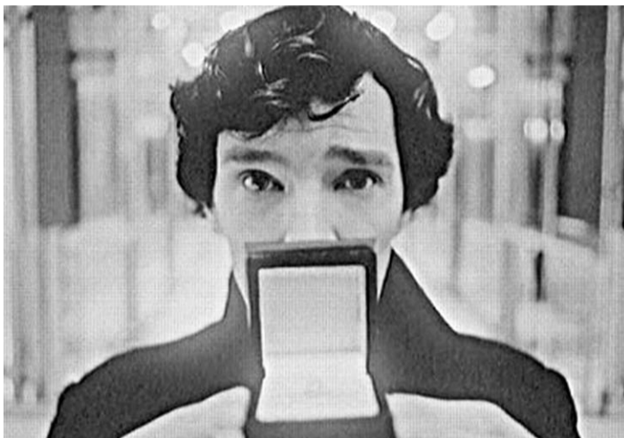
Шерлок в образе котика.

Агента Кулера в линчевском «Твин Пиксе», если помните, погубила любовь. Кабы не полез он за понравившейся девушкой в Чёрный вивгам, глядишь, было бы у сериала ещё продолжение, сезон-десять, ну вот как у «Секретных материалов», и стали бы для зрителя похождения застрявшего в провинциальном американском городе Зеро ФБРовца обыденностью, с каждым годом всё более унылой и безысходной. Но судьба сложилась иначе, и вот положительный персонаж, вернувшись к жизни, встаёт с кровати, отправляется чистить зубы и видит отрицательного в зеркале. Думаю, такое случалось с каждым из нас хотя бы раз в жизни. Наверное,