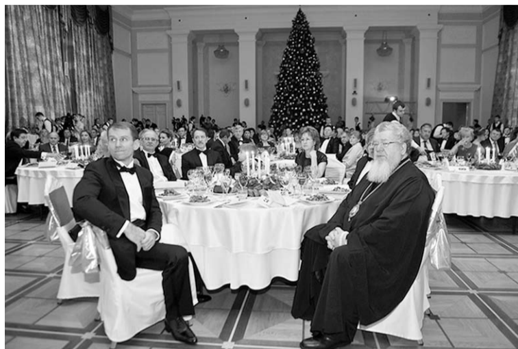
Гости пришли на бал, чтобы поучаствовать в добрых делах.