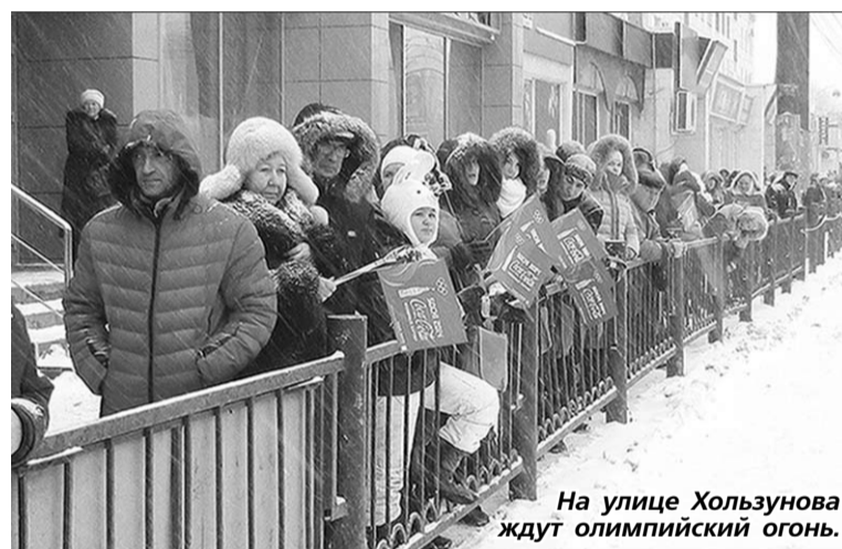
На улице Хользунова ждут олимпийский огонь.

По Адмиралтейской площади олимпийский огонь пронесли двукратная олимпийская чемпионка