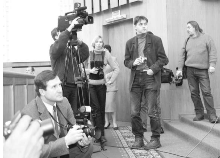
В областной думе.

В 2004 году к 40-летию клуба при поддержке ЮВЖД и усилиями фотожурналиста газеты «Вперёд» Сергея Киселёва издана фотокнига «Дороги «Экспресса». В книге собраны лучшие снимки золотого фонда коллектива и все его достижения. А они немалые: члены клуба – участники и призеры самых престижных конкурсов и выставок художественной и документальной фотографии в стране и за рубежом. Только перечисление их займет несколько страниц текста. Назовем лишь некоторые – «Интерпрессфото-77», Художественные салоны в Бухаресте, Софии, в Париже (Клиши), «Малый