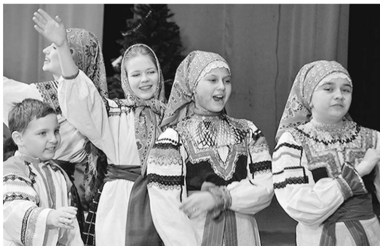
Народные песни в тот день пели и дети, и взрослые.

Надеюсь, недавние выходные останутся в памяти у всех пришедших во Дворец культуры воронежцев.